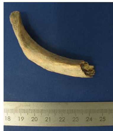
Fig. 1. The rib bone fragment (total weight is 3.89 g) from the archeological site of Hódmezővásárhely in Hungary.

헝가리 남동부 촌드라드 주에 위치한 호드메죄바사르헤이 지역의 약 7000년전 고대 유적지에서 발굴한 시신의 늑골 조각 (3.89 g)을 대상으로 하였다(Fig. 1). 실험에 사용한 핀셋, 그라인더 디스크와 핀, 명반, 메스실린더, 비이커, 시약병 등과 같은 모든 도구들은 세척한 후 과산화수소, 멸균수 및 자외선을 순서대로 처리하였다. 늑골 시료의 표면은 오염을 줄이기 위해 그라인더(Proxxon)로 긁어 내었고, 3% 과산화수소를 발라주었으며, 늑골 조각 양쪽 면에 자외선을 각각 5