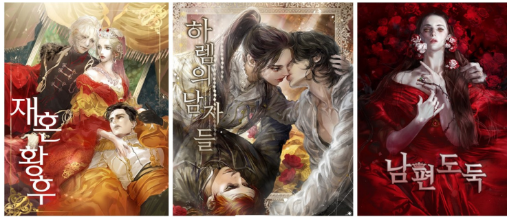
〈그림 2〉 알파타르트×치런의 작품 표지 일러스트(네이버시리즈)

〈그림 2〉는 알파타르트×치런의 작품 표지 일러스트다. 좌측부터 〈재혼 황후〉, 〈하렘의 남자들〉, 〈남편 도둑〉이다. 표지 일러스트는 작품의 분위기와 캐릭터를 시각적으로 표현해서 독자들의 기대감과 몰입감을 높인다. 치런의 일러스트는 회화적 리얼리즘과 고전주의적 장식을 결합한 화려하고 섬세한 화풍을 특징으로 하며, 이를 통해 로맨스판타지 장르의 미적 기대를 충족시키는 동시에 여성 중심의 서사 구조를 강조한다.