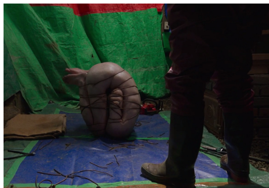
〈그림 1〉 만수에 의해 형태가 고정된 고시조의 시신

어 그 성장 가능성과 존재적 확장 가능성이 철저하게 차단된 인간의 존재론적 축소를 시각적으로 제시한다(〈그림 1〉 참고).