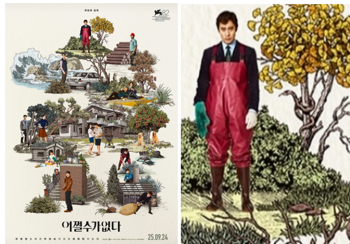
① ② 〈그림 3〉 〈어쩔수가없다〉 영화 포스터 속 사과나무와 뱀 57)

포스트휴먼 디스토피아적 전환의 전조(前兆)로 해석될 수 있다. 특히 〈어쩔수가없다〉의 포스터에 등장하는 뱀과 사과나무를 통해 유추할 수 있듯 (〈그림 3〉 참조), 사과나무는 한때 금단의 지식으로 간주되었던 AI 기술이 기술적 합리성과 효율성의 가치 하에 인간적 선의와 감수성의 소멸을 자연화·정당화하고, 그 결과 탈인간화를 지향하는 기술 중심의 가치체계가 새로운 규범적 권력으로 전화(轉化)되는 포스트휴먼 디스토피아의 전조를 표상한다고 할 수 있다.