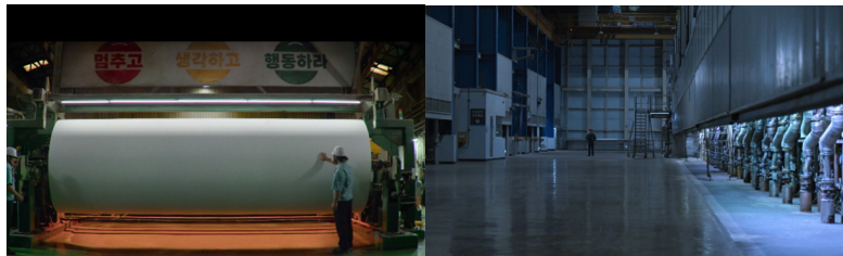
① [태양 제지] 내 공장의 풍경 ② [문 제지] 내 전자동 공장의 풍경

편입되었음을 시각적·공간적으로 재현한다. 그리고 전자동 공장에서 “만 죽한 얼굴” 40) 을 한 만수의 모습은, 그가 체계의 논리를 수행하는 자동화된 주체, 즉 탈인간화된 존재로 이행되었음을 확정적으로 보여준다.