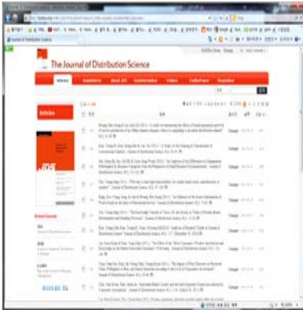
<그림 3> 유통과학연구 조회수

더욱 긍정적인 사실은 <그림 4>에서와 같이 2012년 들어서 해외에서 접속하여 유통과학연구 홈페이지를 열람하는 조회자의 숫자가 급속히 증가한다는 점이다. 20위까지 접속순위를 보면, 한국 Daum이 1위이고, 2위 한국Google, 3위 당 학회 홈페이지, 4위 미국 Google, 5위 한국 Yahoo 순인데, 이중 해외사이트에서 접속하는 것을 보면, 4위 미국 Google, 9위 미국 Bing, 11위 Google CN, 12위 Google HK, 13위 Google JP, 14위 Google UK, 16위 Google CA, 18위 Google MY, 19위 Google TH, 20위 이미지 Google 미국 등이 있다.