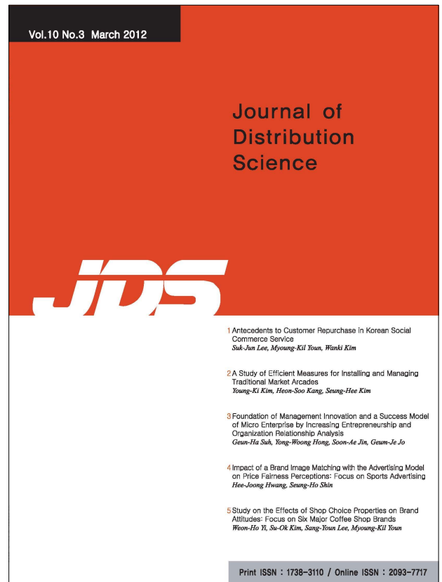
<그림 2> 유통과학연구 표지 샘플

따라서 이와 같은 세계적인 유명저널지로 경쟁력을 갖추려면 하루아침에 되는 것이 아니다. 많은 시간과 투자를 필요로 한다. 이를 위하여 사전 면밀한 대응방안의 마련이 중요하다.