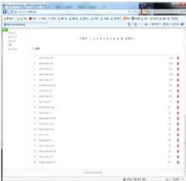
<그림 4> 유통과학연구 국가별 리퍼리 순위

더욱 긍정적인 사실은 <그림 4>에서와 같이 2012년 들어서 해외에서 접속하여 유통과학연구 홈페이지를 열람하는 조회자의 숫자가 급속히 증가한다는 점이다. 20위까지 접속순위를 보면, 한국 Daum이 1위이고, 2위 한국Google, 3위 당 학회 홈페이지, 4위 미국 Google, 5위 한국 Yahoo 순인데, 이중 해외사이트에서 접속하는 것을 보면, 4위 미국 Google, 9위 미국 Bing, 11위 Google CN, 12위 Google HK, 13위 Google JP, 14위 Google UK, 16위 Google CA, 18위 Google MY, 19위 Google TH, 20위 이미지 Google 미국 등이 있다.