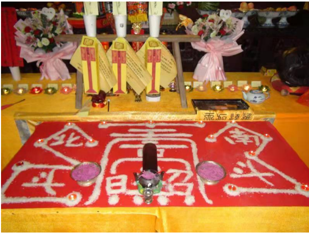
图 4. 礼斗 (Figure 4. Lidou)

礼五斗又称拜斗，乃祭拜天上五斗星君，故在晚上举行。法事开始前，由道长用贡米在香案上绘出“天京主照”、“北斗”、“南斗”几组大字，同时周围摆上蜡烛并点燃。“天京主照”居中，其上三盏蜡烛象征中斗三官，左侧七盏象征北斗七星，右侧六盏意指南斗六星。如图 4：