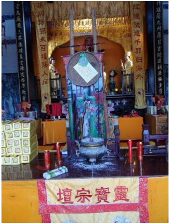
图 3. 卷帘 (Figure 3. Juanlian)

法事过程中，高功在三天前敬香、礼赞，另一名法师拉动长线，让画轴卷起、铺开，象征神光通过三天门照耀下来。同时，拉画轴的法师还要抖动画卷，以画卷的颤动制造天上风吹云动的意象。伴随法师对诸神敬香唱赞，天神神光也就洒满全场。