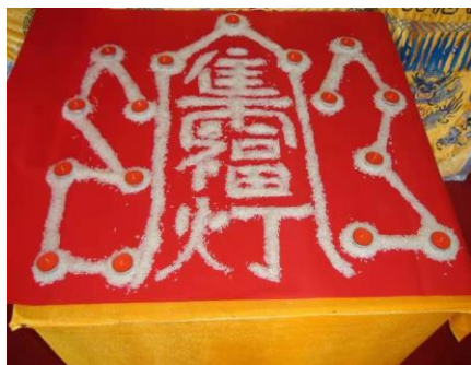
图2 集福灯 (Figure 2. Jifudeng)

本场法事意在通过灯仪为信善祈福——据本观何雄道长介绍，所用《集福灯》科书有句经典唱词：“天上光明唯有日，人间集福莫如灯。”法师用贡米绘出“集福灯”字样，并在周围摆上蜡烛（灯）并点燃，通过燃灯、诵《集福灯》来为信善消除灾厄、迎纳祥瑞。