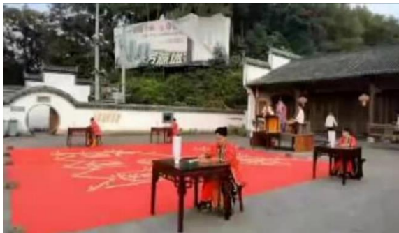
图 5. 水火祭炼 (Figure 5. Shuihuo Jilian)

灵宝祭炼可谓法事“重中之重”。本场祭炼所用科本，是高功饶良清道长家祖传的《丹阳炼科》。饶道长解释说，灵宝派祖师葛仙翁，又被称作“丹阳教主”；灵宝祭炼，即是丹阳炼。饶道长念诵《丹阳炼科》部分经文，再率众走向观外坛场，同时，将备好的斛食，撒向一旁，边走边撒，来到道观门口立好的“水池”“火沼”旁，因为疫情中去世的大量亡灵属于孤尤，进不得大殿，故本场法事须在道观外面举办。高功施法召来亡魂，通过“水池”“火沼”交炼，经由涤除秽垢，将其净化，使之回归正“道”。水火祭炼中的水火，并非一般意义的水火，据《太极祭炼内法》载：“水炼之曰水者，非水也，吾精之泽也。炼吾之精而生彼之精，故化之为水而炼之焉；火炼之曰火者，非火也，吾神之光也。炼吾之神而生彼之神也，故化之为火而炼之焉。精亡神离，昔虽堕而为鬼，精生神全，今当升而生天。炼则度矣，不炼则不度也。故曰‘水火炼度’”(The Daoist Canon. 1988)。