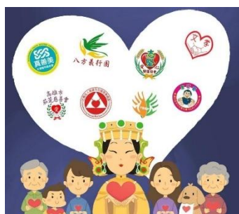
图 9. 公益伙伴 (Figure 9. Philanthropic Partner)

拥有许多公益伙伴（下图九）与广大的信众，秉持着哪里有苦难、哪里就有镇南宫的工作团队的原则，如水灾发生，镇澜宫随即发动信众包了 15000 颗粽子，利用直升机深入灾区，将新鲜的粽子送到灾民手中。2024 年月 8 月携手妈祖传递大爱，把中元普渡 5000 份幸福物资赠送给弱势群体。