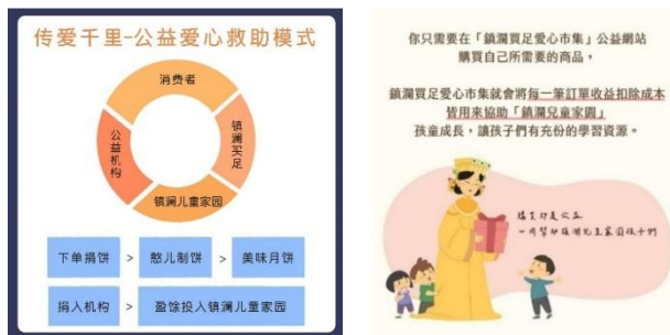
图 3. 买足爱心市集网络协助儿童

目前（2024）该院已经收留了 100 多位院童，但近年来由于大环境不景气的因素导致捐款数目下降，为了让家园减少募款的过度依赖，2017 年成立了「满足爱心市集网络商城」，透过每一笔订单的部分收益皆会用来帮助镇澜儿童家园的孩子成长。爱心市集网络商城以「大甲妈」济世精神出发，持续为社会弱势尽一份心力，传爱千里并开始善的循环。它也是市面上第一个结合公益与宗教的新兴电商，由庙方发起公益项目，募集公益机构所需要的物品给公益机构，参加公益项目的朋友可以拿到过炉祈福的赠品以及电子发票、公益机构的感谢状。除此之外，平台的部分盈余会捐入镇澜儿童家园，用来帮助儿童家园内的失依儿童成长。利用一份爱心、产出三份帮助。为了能够建立家园的财务自主。在这过程当中，定期会有儿童家园的小朋友到门市进行实习，教导学生做简单的网页编辑、商品上架、门市销售，藉以增加孩子的就业能力培养及专长，有助于孩童将来就业发展。