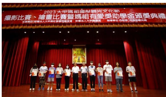
图 4. 摄影、绘画、妈祖有爱奖助学金颁奖典礼

1. 为发扬圣母慈恩慈爱之精神，奖助设籍在大甲/大安/外埔/后里等区一年以上， 国中、高中职、专科、大学在学学生与辖区内安置机构特订本办法。