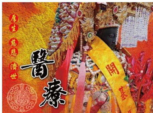
图 8. 强调厚生、慈悲、济世医疗团 (Figure 8. Dajia Volunteer Medical Team Sun Visor)