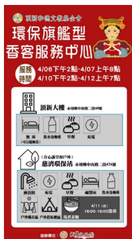
图 13. 顶新和德文教基金会服务内容

(Figure 13. Programs and Services of the Ting Hsin Hede Cultural and Educational Foundation)