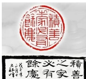
图 1. 积善之家必有余庆

佛经中也常提到作不同的布施会得到不同的果报，譬如供花或施衣的果报是会长得端正庄严。布施饮食的果报是身体强壮有力气。另外月灯三昧经云布施十种利益：布施乃破悭贪之前阵，入道之初门。菩萨行能此者，则获十种利益也，财布施，以财物去救济疾病贫苦，很多人以为布施就是功德，所以常捐钱给慈善团体以积善，此认知下让台湾的公益团体蓬勃发展。