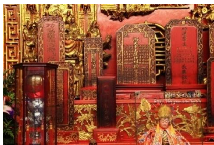
图 2. 大甲镇澜宫长生录位 (Figure 2. Longevity Registration Plaque of Dajia Zhenlan Temple)

址建祠，清雍正 10 年(1732)大甲里兴建小祠，直到清乾隆 35 年(1770)由地方士绅林对丹等人捐资重修，始具规模，使妈祖庙成为大甲地区 53 庄居民(今大甲、大安、外埔、后里四区)的信仰中心(Chen 1977, vol. 6, 150)，改建小庙为「天后宫」。清乾隆 52 年(1787)，载于淡水厅文献中，由大甲分司宗颢庭、进士陈峰毫、士绅连昆山、平埔族原住民头目巧化龙、副通事淡眉他湾、土目郡乃盖厘、业户蒲氏本步四位为当时道卡斯族(TAOKAS)大甲西社仍然使用传统原住民姓名之副通事、土目及土地业主，由此得知大甲镇澜宫之土地权，是由当时大甲西社头人家族所捐献等著名檀越发起献地重建，将天后宫扩建，清乾隆 55 年(1790)，吴遍等重修(Chen 1977, vol. 6, 150)，此次重修于乾隆 58 年(1793)，被载于陈培桂《淡水厅志卷六》文献中。