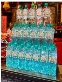
图 12. 台盐海洋碱性离子水 (Figure 12. Taiyen Ocean-Based Alkaline Ionic Water)

版妈祖、吉祥金龙图案及「龙来转运，平安好运」祝福字眼，相当具有收藏价值。喝台盐海洋碱性离子水保底好运气，台盐公司邀请信众一起箱购参加抽奖活动，抽 10 万元旅游现金大礼。