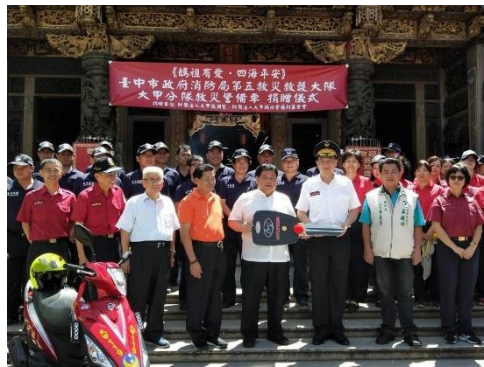
图 11. 妈祖有爱，四海平安，捐赠消防警备车 (Figure 11. Mazu's Love for All, Peace Around the World — Donating a Firefighting and Patrol Vehicle)

大甲镇澜宫长年热心地方公益，不遗余力，高度的肯定与支持消防工作，特别捐赠一辆消防救灾车，将提供第五救灾救护大队大甲分队勤务使用。消防局表示，感谢大甲镇澜宫积极参与社会服务，希望藉此抛砖引玉，鼓励更多社会资源挹注于消防救灾工作上。