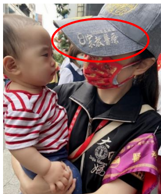
图 7. 大甲医疗团遮阳帽 (Figure 7. Dajia Volunteer Medical Team Sun Visor)