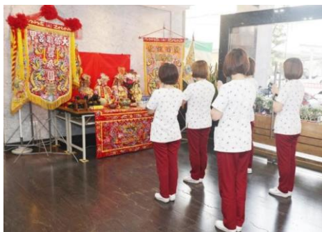
图 5. 大甲镇澜宫医疗团

两岸交流、文化观光、社会公益或经济产业上，均深获全球友宫及各界信众的好评与支持。