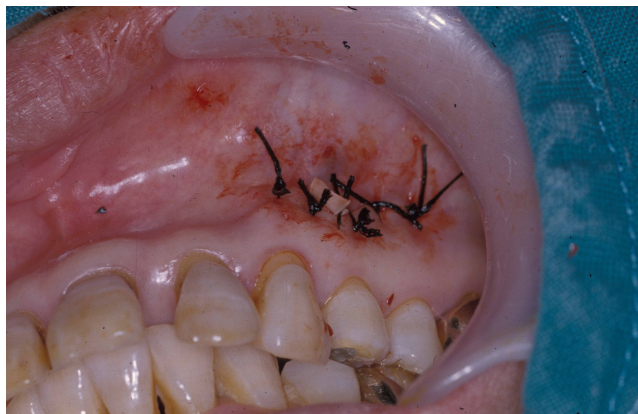
Figure 2. The rubber drain insertion in the sutured wound around the apicoectomy site.