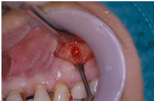
Figure 1. The open wound around the apicoectomy site of the maxillary left first premolar

치근단 절제술은 통상적인 방법으로 시행했으며 다만 봉합술 시행시 골형성을 촉진하고 창상치유를 돕고자 봉합사를 하나씩 결찰하지 않고 모든 봉합시 골막점막 피판 (mucoperiosteal flap)이 확실히 봉합에 포함되게 3-0black silk를 결찰전 mosquito로 집어넣고서 모든 봉합술 완료후 하나씩 결찰하는 방식을 사용했다. 봉합술을 완료한 다음에는 치근단 절제술 시행병소부 내부로 3~5mm 폭경의 rubber drain을 삽입해 술후 혈종형성과 감염방지를 도모했고 구강외부 상순부위에 압박을 위한 pressure dressing은 시행치 않았다(Figure 2).