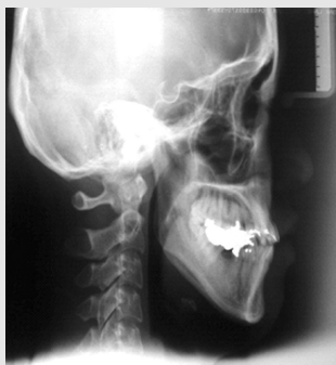
그림 4. Pre-op Cephalometric lateral view