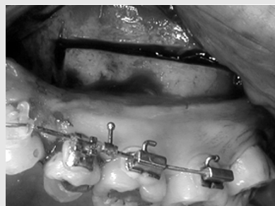
그림 7. 상악 수술