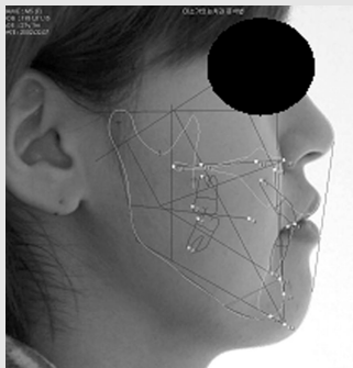
그림 6. Pre-op Cephalometric Analysis