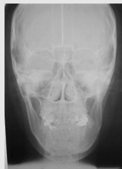
그림 5. Pre-op Cephalometric PA view