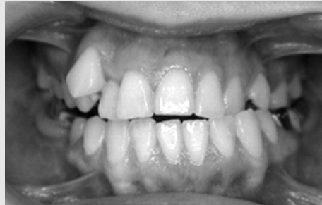
그림 2. Pre-Op. intraoral photograph