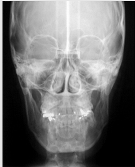
그림 10. Post-op Cephalometric PA view