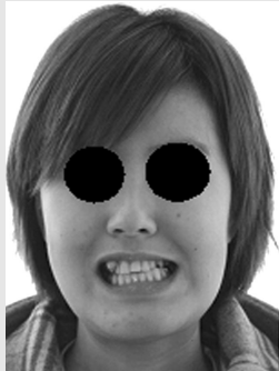
그림 1. Pre-op. Extraoral photograph