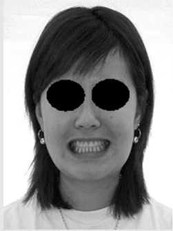
그림 8. Pre-op. Extraoral photograph

2. 교정 처치 및 경과 : 상악 좌우 제1소구치(#14, #24)교정 발치 상악 호선의 교환순서 : .012Niti, .014Niti, .016x,022Niti, .017x,025SS 하악 호선의 교환순서 : .014Niti, .016x,022Niti, .017x,025SS