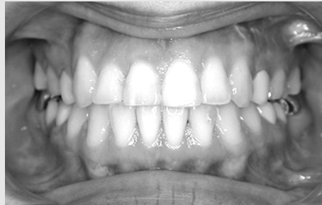
그림 9. Post-op. Intraoral photograph