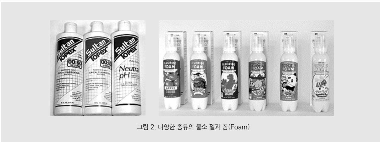
그림 2. 다양한 종류의 불소 젤과 폼(Foam)