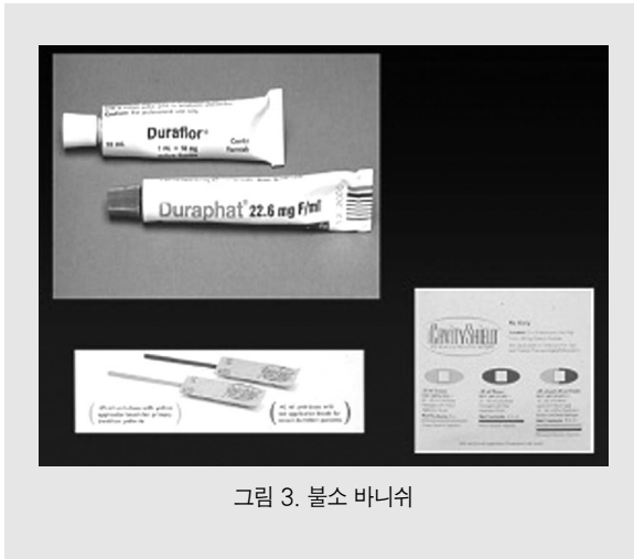
그림 3. 불소 바니쉬