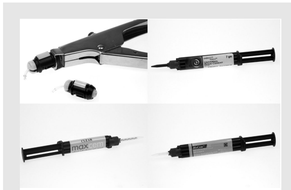
그림 2. 국내에서 판매중인 self-adhesive resin cement. 좌측의 위부터 시계방향으로 Rely-X Unicem(3M ESPE), Embrace Wetbond Universal resin cement(Pulpdent), Maxcem(Kerr), BisCem(BISCO). Rely-X Unicem 만이 캡슐 형태로 특별한 혼합 장비가 필요하다.

없고 보조자에 관계없이 일정한 혼합비를 유지할 수가 있다. Rely-X Unicem의 경우는 이 제품만을 위한 특별한 혼합기를 이용하여야 하며 캡슐형태를 가지고 있기 때문에 다른 제품들이 여러 개의 지대치에 cement를 이용하더라도 한 개의 시린지로 추가 혼합 없이 사용 가능한 것에 비해 3개의 지대치 이상을 합착하는 경우 또 다시 캡슐을 혼합하여야 하는 단점이 있다.