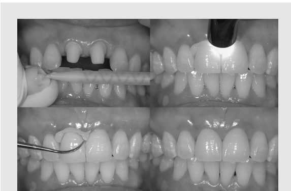
그림 1. Self-adhesive cement를 전치부 완전도재관의 합착에 이용하고 있다. 단순히 시린지를 짜서 cement를 수복물의 안에 바르기만 하면 합착은 끝이 난다. 치아와 수복물의 내면에 어떠한 처리도 하지 않는다.(Maxcem의 사용 예, Kerr 제공)