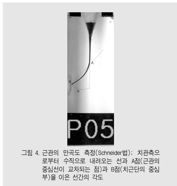
그림 4. 근관의 만곡도 측정(Schneider법); 치관측으로부터 수직으로 내려오는 선과 A점(근관의 중심선이 교차되는 점)과 B점(치근단의 중심부)을 이은 선간의 각도

근관 성형 후의 근관 중심이 이동된 양을 평가하기 위해 근관중심 변위율을 산출하였다. 비율이 낮을수록 기구의 근관의 중심을 잘 유지하는 것을 의미한다. 치근단으로부터 1.3mm에서 수평적으로 근관 삭제량을 측정하고 다음 방법에 따라 중심변위율을 산출하였다: