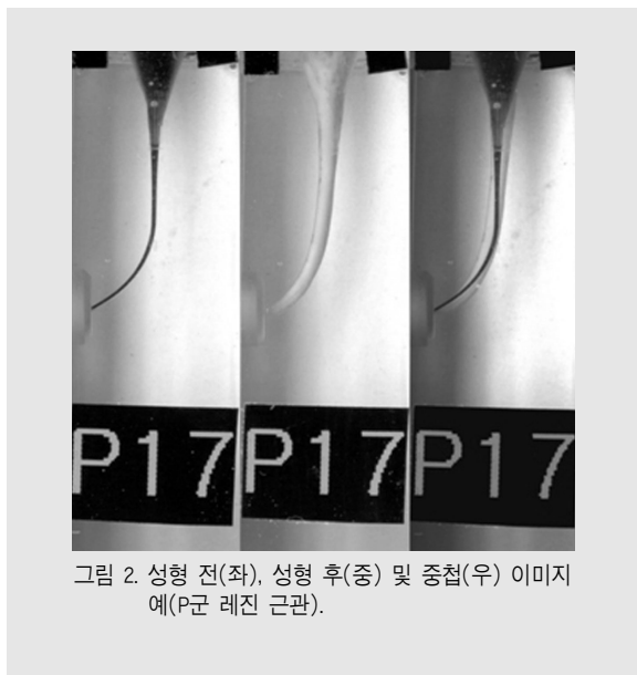
그림 2. 성형 전(좌), 성형 후(중) 및 중첩(우) 이미지에(P군 레진 근관).

근단부를 30번까지 확대하고 근관에 Vitapex (Neo Dental Chemical Products co., LTD, Tokyo, Japan)를 주입하고 스캐너로 다시 술후 이미지를 채득하였으며 이 과정을 근단부를 40번과 50번까지 확대 후 동일하게 시행하였다. 모조 근관 블락에 부착한 표식을 참조로 하여 삭제 전 근관 이미지와 삭제 후 근관 이미지를 완전히 겹쳐지도록 Photoshop (Adobe, San Jose, CA, USA) 프로그램을 이용하여 중첩시켰다(그림 2). 이 중첩 이미지 (2944 × 1096 pixel size)를 1680 × 1050 해상도의 TFT-LCD 모니터(TopSync OR2200W; Samsung, Suwon, Korea)에서 평가하였다.