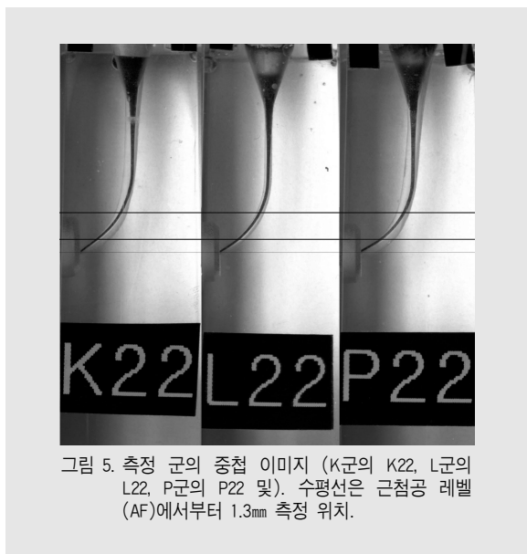
그림 5. 측정 군의 중첩 이미지 (K군의 K22, L군의 L22, P군의 P22 및). 수평선은 근첨공 레벨 (AF)에서부터 1.3mm 측정 위치.

그림 5는 삭제 전의 근관과 근단부를 50번까지 확대한 후의 중첩 이미지이다.