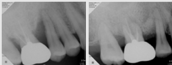
Pre-operative(Left) and Six months post operative Radiographs(Right).