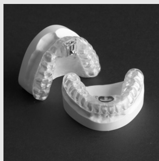
Fig. 7. Thornton Adjustable Positioner® (TAP®)