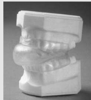
Fig. 3. Tongue retaining device (TRD)