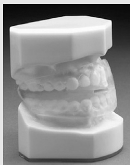
Fig. 6. Elastomeric Appliance

Mandibular repositioners는 기계적으로 하악을 전방 위치시킴으로써 간접적으로 혀와 그 기저부를