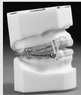
Fig. 9. Herbst Appliance®