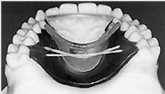
Fig. 4. Tepper oral proprioceptive stimulator(TOPS)