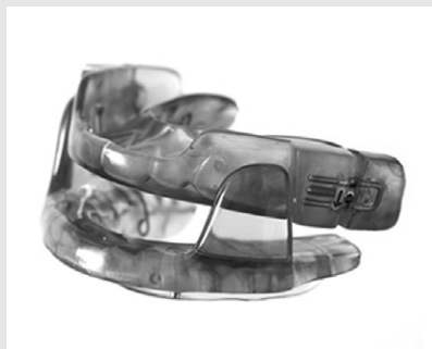
Fig. 8. SomnoMad®