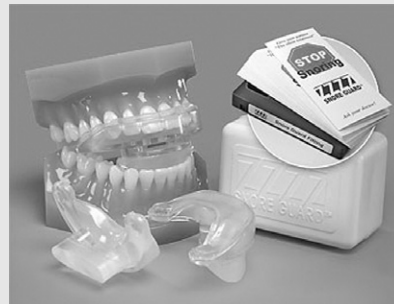
Fig. 5. Snore Guard™