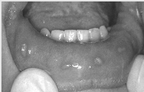
그림 1. 원발성 헤르페스 치은구내염(Acute Primary Herpetic Gingivostomatitis). 다발성의 궤양이 하순의 점막에 나타난다.

얇은 궤양이 각화상피나 타액선이 있는 구강점막 표면에 나타난다(그림 1). 발열, 림프절병증(lymphadenopathy), 근육통 등의 전신 증상을 동반하기도 한다 6) . 이 감염은 주로 어린아이에게서 나타나며, 2~10일 정도 지속되는 발열과 림프절병증이 나타난다. 약성종양때문에 화학요법을 받거나 장기이식, AIDS환자와 같은 면역 억제 환자에서는 급성 원발성 헤르페스 치은구내염이 장기형으로 발달한다. 이런 환자는 표층병소가 건강한 사람의 경우보다 더 크고 깊게 나타난다.