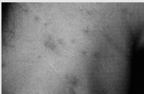
그림 4. 수두(Chickenpox). 다수의 홍반형의 수포가 목의 오른쪽에 나타난다.

대상포진이 삼차신경절을 침범하면, 편측성의 안면 및 구강병소가 눈, 상악, 하악지 신경을 따라 나타난다. 구강점막 표면의 병소는 신경 분포를 따라서 매우 뚜렷한 편측성 발현 양상을 보인다.