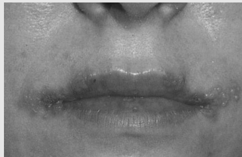
그림 2. 재발성 구순 헤르페스(Recurrent Herpes Labialis). 액체로 채워진 수포들이 상순과 하순에 나타난다.

가장 호발하는 재발성 단순 헤르페스 감염의 형태로, 주로 입술에 나타난다(그림 2). 삼차신경절에 존재하는 헤르페스 바이러스의 재활성화에 의한 질환으로 장시간에 걸친 일광노출, 외상이나 입술에 대한 처치, 발열, 면역억제, 생리, 스트레스와 같은 다양한 원인에 의해 나타난다. 치료는 경험적으로 병소를 부드럽게 유지하고 확산과 이차감염을 방지하기 위해 연고로 도말하는 방법을 사용한다.