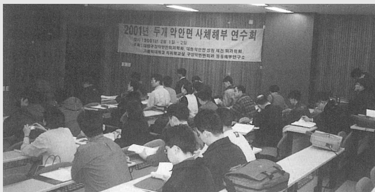
그림 3. 사체해부연수회

누어지는데, 종양 조직의 절제와 이로 인해 생긴 결함을 재건하는 것이다. 구강암뿐만 아니라 대부분의 악성 종양은 주위 조직으로 넓게 침습하는 성질이 있으며 혈관이나 임파관을 통해 전이되는 성질도 있으므로 종양 조직을 절제할 때도 반드시 이것을 고려해야 한다. 따라서 구강암의 경계부에서 정상 조직을 포함해서 종양을 절제하고 필요에 따라서 목의 임파관과 주위 조직을 절제하게 된다.