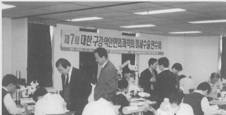
그림 2. 구강암 및 미세수술 연수회