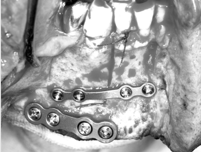
그림 3. 술후 고정된 모습

단술 및 술후 고정방법을 분석하여 얻은 결과로서 이러한 방법 시행이후 부정교합이나 측두하악관절의 이상은 더 이상 관찰되지 않고 있다.