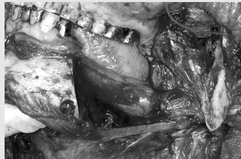
그림 6. 하협부피판 접근법으로 하악골의 분절절제술 및 경부 임파선 제거술을 같이 시행한 모습