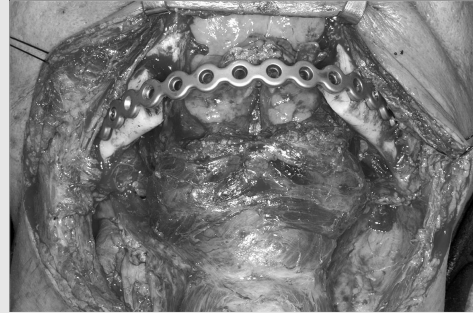
그림 4. 면갑피판 접근법을 이용하여 하악골 전치부의 종양과 경부 임파선 제거술을 동시에 시행한 모습.

경부의 주름살을 따라 한쪽 유양돌기(mastoid process) 부위에서부터 반대쪽 유양돌기까지 수평절개를 한 후 구강내 순측, 협측 전정절개를 함께하여 피판을 거상, 구강을 노출시키는 접근법이다. 장점은 정중부에서 하순과 이부를 절개하지 않아도 된다는 점이며 단점은 이신경(Mental nerve) 손상에 기인한 하순과 이부의 감각상실 9) 이다. 비록 구강의 전방에 위치한 종양에는 노출이 충분하지만, 혀 2/3 부분이나 후구치 삼각쪽에 위치한 종양에는 부족할 가능성이 있