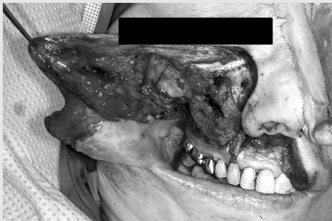
그림 5. 상악골의 종양을 제거하기 위해 상협부피판 접근법을 안와축 연장시킨 모습

앞서 언급한 경구강 접근법보다 더 좋은 수술시야가 요구될 경우 이용되는 접근법으로서, 하협부피판 접근법 (Lower cheek flap approach)은 구강내 종양 절제술시 충분한 노출을 제공해주며, 구강내 종양과 경부 임파선의 일괄 절제가 가능한 접근법이다. 정중부에서 하순과 이부를 수직으로 절개하고 수술부위 쪽 경부의 수평절개로 연장시켜 하악골 한쪽 및 하방