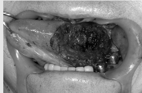
그림 1. 경구강 접근법을 통해 혀 측방에 발생한 종양을 절제한 모습

Transoral approach라고도 불리우는 이 접근법은 주로 혀, 구강저, 치은, 협점막, 그리고 경구개나 연구개 부위의 크기가 작은 표재성 암종 또는 백반증과 같은 구강내 전암병소 제거에 주로 이용되고 있다. 즉, 구강내 과각화 병소에 대한 레이저 조직검사 또는 백반증과 같은 전암 병소의 레이저 기화 (Vaporization) 술식, 혀의 측방부에 생긴 표재성 종양 제거를 위한 부분 설 절제술 (partial glossectomy), 구강저, 치은, 협점막 부위의 병소 절제술, 경구개, 연구개 부위의 양성 또는 악성종양 절제술 등은 환자의 개구량이 충분해서 좋은 시야만 확보할 수 있다면 모두 경구강 접근법으로 가능하다. Dingman 개구기 또는 바이트블록으로 개구상태를 유지시키고 입술열개 (mouth retractor) 또는 army-navy 견인기로 입술을 젖혀 시야를 확보하는 것이 중요하고 혀가 시야에 방해되지 않도록 견인기를 적절히 사용하도록 한다. 경구강 접근법은 무엇보다도 간단하고 시간이 적게 걸리며 불필요한 외부절개를