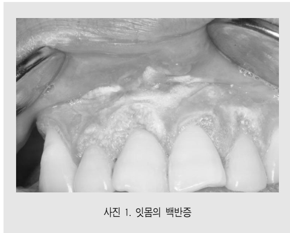
사진 1. 잇몸의 백반증

일차적으로 조직생검을 하기 전에 육안적으로 잠정적인 진단(tentative diagnosis)이 가능하다. 구강 백반증은 거즈 등으로 문질러도 벗겨지지 않으며 다른 질환으로 분류할 수 없는 백색 병소를 말한다(사진 1). 홍반증은 육안적으로 매끄럽고 밝은 적색을 띠는 구강 점막으로 다른 질환으로 분류할 수 없는 적색 병소를 말하며, 만성 과증식성 칸디다증은 영양결핍증, 면역 억제 복용, 광범위 항생제나 세포 독성이 있는 약제를 장기간 복용하거나 잘 맞지 않는 틀니를 계속 사용할 때 단단한 회백색의 프라그(plaque)가 형성되는 것을 말한다. 홍반증이나, 만성 과증식성 칸디다증을 조직 생검 하면 대부분 상피 이형성(epithelial dysplasia)를