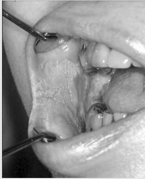
사진 2. 협점막의 백반증