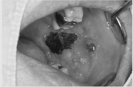
사진 3. 협점막의 백반증을 CO2 Laser Vaporization한 사진

병소로 이행될 가능성이 있다는 것이다. 구강 백반증을 조직병리학적으로 상피 과형성(epithelial hyperplasia), 경도(mild) 상피 이형성, 중등도(moderate) 상피 이형성, 고도(severe) 상피 이형성으로 분류 하며 악성 이행 위험도(cancer progression risk)를 결정하는 기준을 주로 상피 이형성의 정도에 기초한다.