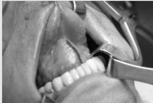
Fig. 2. Incision was designed vertically in mouth floor. Note severe elevated tongue and dome-shaped mouth floor because of huge mass.

조직학적 소견상, 섬유성 피막 내에 각화된 중층편평상피세포로 구성되어 있었으며, 이 섬유성 피막은 상피부속기, 즉 모포(hair follicle), 한선(sweat gland), 피지선(sebaceous gland)를 포함하고 있어, 유피낭종으로 확진하였다. 술후 환자는 수술일로부터 2일째 퇴원하였고, 술후 6개월 경과 후 지금까지 재발 등의 특이 소견 및 어떠한 합병증도 없이 추적 관찰 중이다.