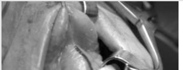
Fig. 1. A and B preoperative coronal & axial contrast enhanced CT scan of case shows a large cystic mass in floor of mouth. CT scan showing a large hypodense non enhancing mass between the genioglossus and mylohyoid muscles. C. Patient's chin looks like double chin due to size and location of cyst, and the mass compressed oropharyngeal airway space in mid-sagittal CT view.

설하 종창이 혀에서 입천장을 향해 발생되므로 저작, 발음, 호흡 곤란을 일으킨다. 이설골근 하방에 발생하는 경우에는 이부 종창으로 인하여 이른 바 '이중턱(double chin)'이 된다 5) . 발생빈도는 성별에 따라 별 차이가 없으며 6) 연령별로는 어린이에게 드물며 7) 주로 10~20대에 발생하며 임상증상은 서서히 성장하며, 피부나 구강 촉진 시에 고무(rubber)를 누르는 듯한 촉감을 나타내는 무통의 종물성 질환이다 8,9) . 구강저 부위의 유피낭종은 대개 청년기에 발견된다. 초진시, 환자의 과거 병력과 임상증상, 흡입검사 및 방사선 소견 등을 참고하여 하마종 등의 다른 질환과 감별진단을 요하며, 수술 방법은 외과적 적출술이 추천된다. 술후 예후는 적절히 적출되는 경우에 양호하며, 재발률은 거의 없다. 조직병리학적으로 과립세포증이 잘 나타나는 중층편평상피로 이루어져 있으며 내강에는 각질이 풍부하고 낭종벽은 다수의 피지선과 한선 등 피부 부속기를 포함한 결합조직으로 구성되어 있다.