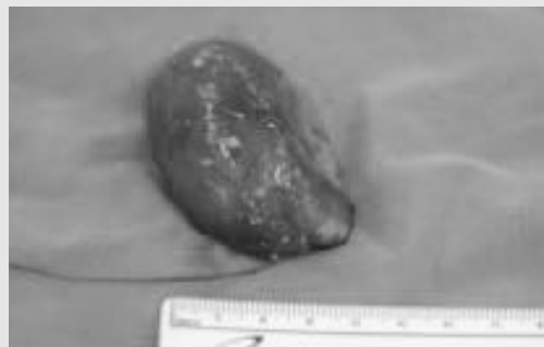
Fig. 4. The extirpated mass was round. The specimen was yellowish white in colour, soft in consistency and cystic in nature. The mass was measured 4×6×4 cm and upon sectioning, was filled with a cheesy material.