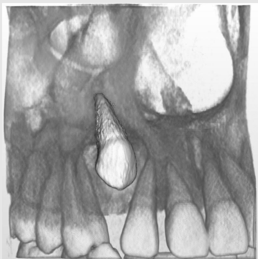
Fig 1. Three dimensional reconstruction image of impacted canine from CT scanning

각 계측 자료들은 통계 분석에는 SPSS(Ver. 12.0, SPSS Inc., Chicago, IL, USA) 프로그램을 이용하였으며 연령, 3차원 영상에서 설정한 3가지 기준평