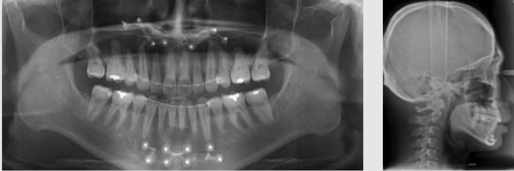
Fig. 3. Radiographic findings after treatment. (A) panoramic radiograph, and (B) lateral cephalometric radiograph.