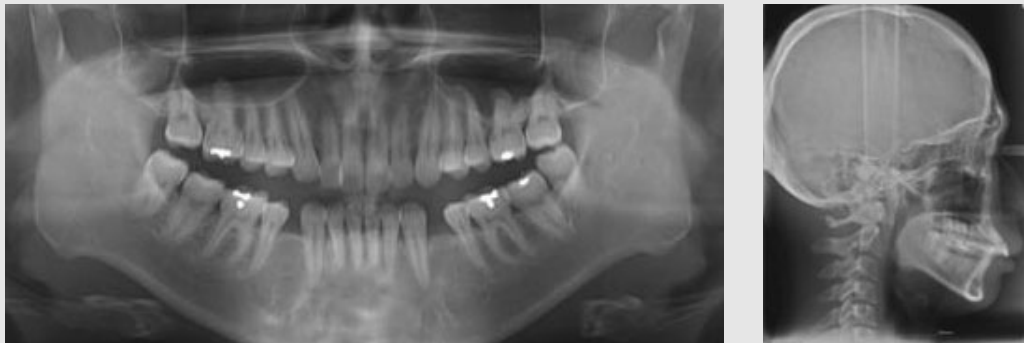
Fig. 1. Radiographic findings before treatment. (A) panoramic radiograph, and (B) lateral cephalometric radiograph.

이미 하악 양측 제1소구치의 발치가 되어있는 상태였기 때문에 처음 진단하였던 치과의원의 계획대로 상악 양측 제1소구치를 발치한 후 전방골분절술을 시행하기로 하였다. 상악은 술전교정을 통해 전치부의 총생, 양측 견치의 치축을 수정하고 발치 공간을 이용하여 5mm의 후방이동(setback), 상악전치부 함입(intrusion)을 위한 2mm의 상방이동(superior