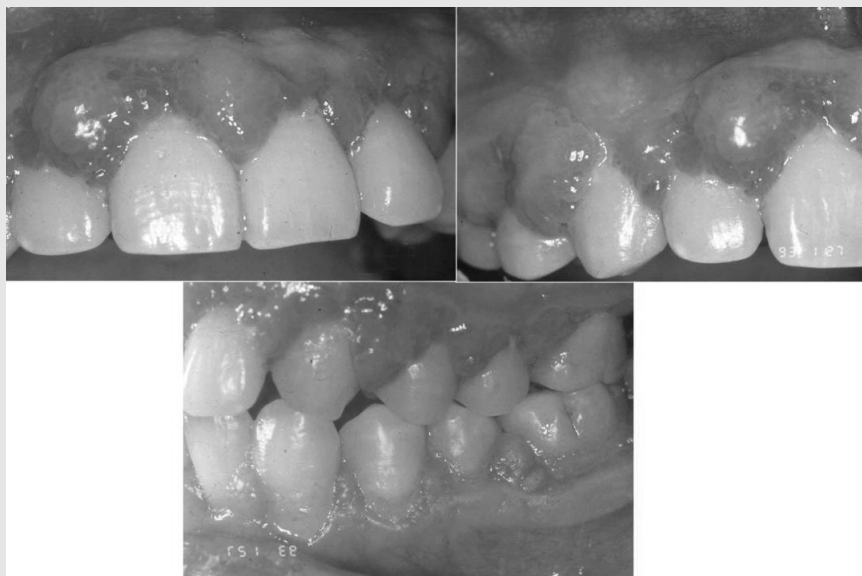
그림 3. 약물(Cyclosporine)에 의한 치은 증식증. 신장이식후 Cyclosporine을 투여 받은 환자에서 상하악 전체 순면면에 전반적인 치은 증식을 볼 수 있다. 미약한 염증을 동반하여 치간유두 부위에 발적을 볼 수 있다.