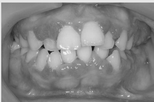
그림 4. 만성 증식성 치은염 (Chronic hyperplastic gingivitis). 상하악 치은의 전체적인 발적과 변연 및 유두치은의 과증식이 관찰된다.

치료는 생검과 신장 또는 폐 침범 여부에 따라 결정되며, 신장에 침범된 경우에 치명적이다. 화학 요법이 선택적 치료법이다. 따라서 국소적인 치은 치료 보다는 내과 의사와 함께 의뢰하여 조절해야 한다. Cyclophosphamide와 프레드니손 병행요법으로 치료하며 재발이 흔하다.