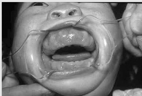
그림 1. 치은 섬유종증 (Gingival fibromatosis). 어린이에서 전반적인 치은증식증으로 유치의 맹출 장애를 보이고 있다. 치은은 섬유화되어 견고하다.

Dilantin과 Nifedipine에 의한 치은 비대는 임상적으로 유사하다. 약물 복용 1~3개월 후 치간유두 부위에서 시작하고 점차적으로 치관이 눈에 보이지 않을 때까지 커지는 경향이 있다. 대개 Dilantin 복용환자는 25세 이전에, Nifedipine 복용환자는 중년 이후에 발생한다. 임상적으로 치은비대는 산재성이며 단단하다. 염증 동반은 다양하나 치은비대는 구강위생이 좋지 않는 환자에게서 더욱 심하다(그림 2). Cyclosporine은 장기이식 환자의 면역억제 약물로 흔히 투여한다. 이 약과 관련된 치은비대는 Dilantin과 Nifedipine을 함께 사용할 때보다는 덜 심하게 나타난다. 치은은 다엽 혹은 유두상 외형을 나타낸다. 치은 비대가 진행되면, 위치주낭(pseudopocket)이 치아의 치관 주위에 형성된다. Dilantin과 Nifedipine에 의한 치은비대는 치은, 특히 협측이나 순측에서만 주로 나타난다. 그러나 Cyclosporine은