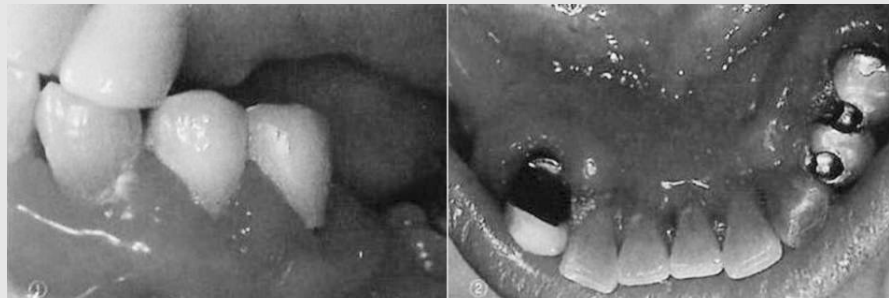
그림 6. 급성 골수구성 백혈병 (Acute myelogenous leukemia). 잔존하는 상하악 전치부 및 소구치부 협설축으로 전반적인 치은비대 소견을 보인다.

전반적인 치은비대를 초래하는 치은 섬유종증, 약물에 의한 치은비대증, 증식성 치은염, 웨게너 육아종증, 백혈병의 임상적 특징과 감별진단, 그리고 임상적 중요성에 대해 기술하였다. 일선 치과외과에게 가장 문제되는 질환은 웨게너 육아종증, 백혈병이다. 치은 섬유종증, 약물에 의한 치은비대증, 증식성 치은염의 경우 구강위생 관리와 더불어 치은절제술이 가능하므로 일선 치과외과들이 치료하기가 쉽다. 다만 전반적인 치은비대 질환을 감별하기 위해 먼저 간단한 혈액학적 검사를 시행하는 것이 좋으며, 치은절제 후 절제된 조직을 버리지 말고 구강병리과에 생검의뢰해 현미