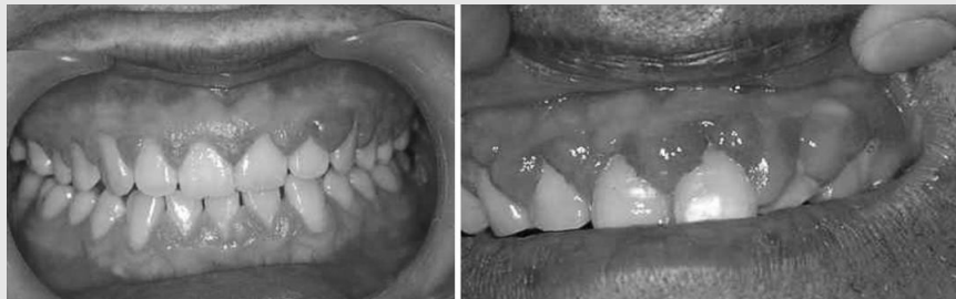
그림 2. 약물성 치은증식증 (Drug-induced gingival hyperplasia). (a) 항간질제인 디란틴(Dilantin)에 의한 치은 증식증. 주로 치간유두에 미약한 치은 증식증을 볼 수 있다. 미약한 염증을 동반하고 있다. (b) 칼슘 통로 차단제인 Nifedipine에 의한 치은 증식증. 치간유두를 포함하여 상하악 전체에 전반적인 순면의 치은 증식을 볼 수 있다. 심한 염증을 동반하고 있어 염증에 의한 증식성 치은염과 유사하게 보인다.

증식성 치은염은 염증 반응과 연관되어 변연치은의 국소 또는 전체성 섬유성 과증식을 말한다. 만성치은