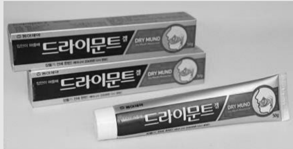
그림 1. 구강 보습제 드라이문트(동아제약)

구강 보습제와 suction을 이용한 구강위생관리 방법은 다음과 같다(그림 2).