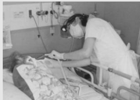
그림 6. 헤드라이트로 밝은 시야를 확보하여 전문적 구강위생관리를 시행하는 모습