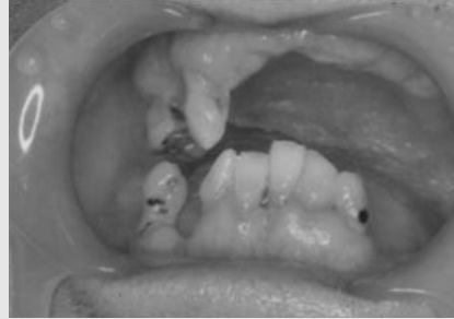
그림 9. 입술에 젤을 도포하고 angle retractor를 장착한다.