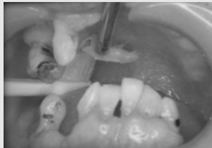
그림 13. 모가 부드러운 칫솔을 사용하여 입천장과 혀에 붙어 있는 부스럼 모양의 가피를 제거한다.