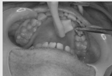
D. 흡인 후의 구강