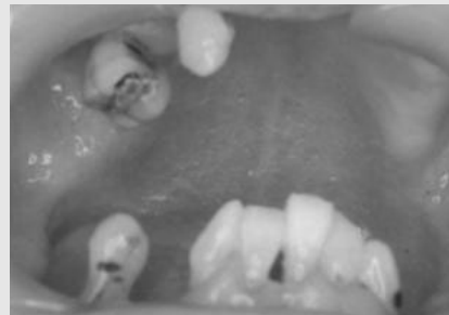
그림 15. 전문적인 구강위생관리 시행 후