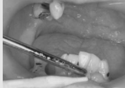
그림 12. 칫솔 치간칫솔 등으로 칫솔질하고 항상 suction tip으로 오염물을 흡인한다.