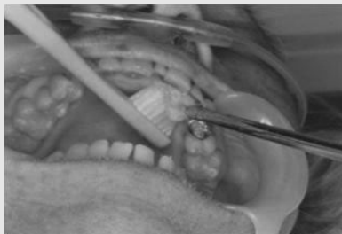
C. suction tip으로 박리상피, 가래의 흡인