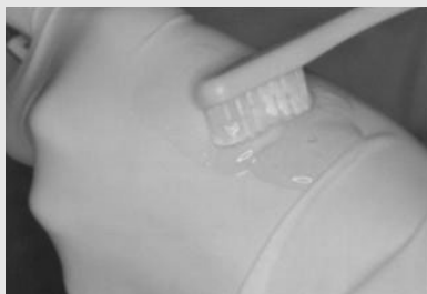
A. 구강보습제를 글러브를 착용한 손 등에 적당한량을 짬다.