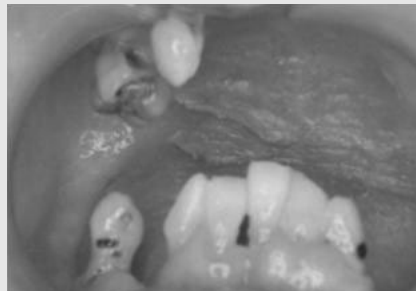
그림 14. 전문적인 구강위생관리 시행 전