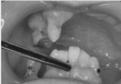
그림 10. 제거 가능한 가래와 음식물 잔사 등은 가능한 suction tip으로 빨아낸다.