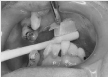
그림 5. 구강보습용 젤로 오염물을 뭉쳐서, suction tip으로 제거하는 모습