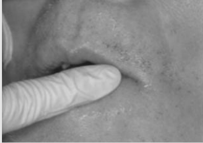
그림 8. 입술주위에 구강보습용 젤을 도포하고 있다.