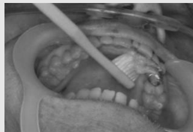
B. 구강보습제를 도포하여 박리상피와 가래를 처리한다.