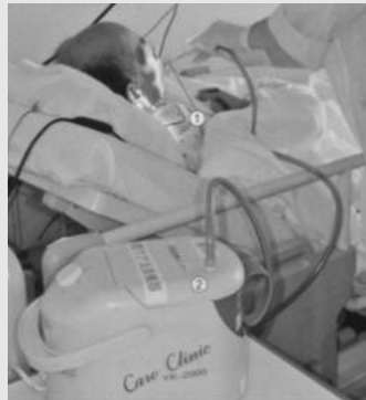
그림 4. 흡인기를 사용하는 모습