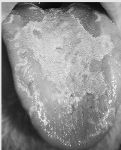
그림 4. 양성 이동성 설염.

치과의사가 임상 현장에서 구강점막질환을 정확하게 진단하고 이를 바탕으로 하여 적절하고 효과적인 치료를 수행하기 위해서는 병소의 이해가 필수적이다.