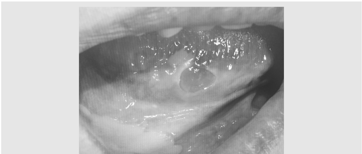
그림 3. 혀 측면에 발생한 궤양을 동반한 백반증. 조직검사서 편평세포암종으로 진단되었음

혀 등쪽의 사상 유두(실유두)가 비정상적으로 길어져서 육안으로도 확인할 수 있을 정도의 길이로 자란 상태를 말한다. 마치 혀에 털이 난 것처럼 보이기