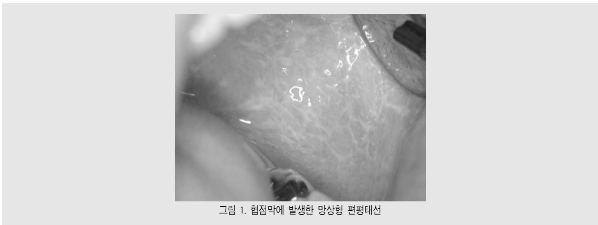
그림 1. 혀점막에 발생한 망상형 편평태선

편평태선은 면역학적 원인으로 인해 발생하는 것으로 생각되는 질환이며 구강점막과 피부에 구진성 병소를 나타낸다. 구강 점막에 홍반성 병소를 형성하며 백색의 선 모양, 레이스(그물) 모양을 보이는 병변이다. 망상형이 가장 흔하며 미란형, 반점형 병소를 형성하기도 한다. 망상형 편평태선에 나타나는 레이스 모양을 '위감 선조(Wickham 선조)'라고 부른다(그림 1).