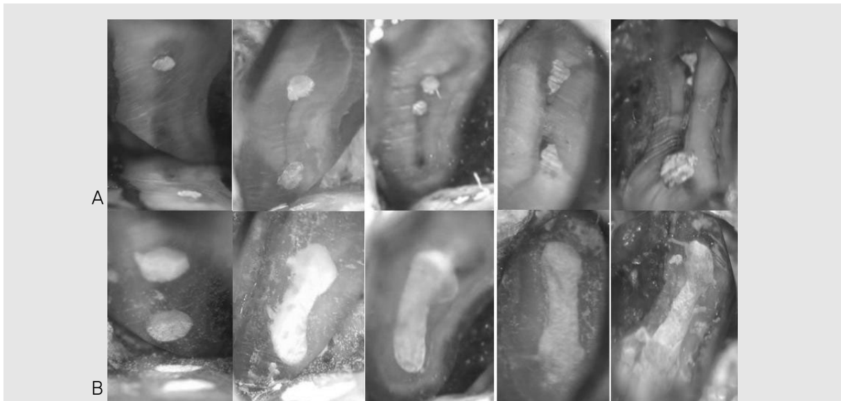
그림 3. 절단된 치근단면을 고배율로 관찰하여 이전 치료가 실패한 원인을 알 수 있고, 적절하게 치료할 수 있다. (A) 메틸렌블루 염색 후 25배 확대 하에서 관찰한 치근단면. Isthmus, missing canal 등 근관치료 실패의 원인이 관찰된다. (B) MTA를 이용한 치근단 역충전 후 사진.

치근단 미세누출 폐쇄 술식의 또 다른 장점은 초음파 팁을 이용한 치근단 와동 형성이다. 전통적인 치근단 수술에서의 치근단와동 형성은 주로 handpiece 나 micro-handpiece를 사용하였는데, 이는 근관의 장축에 평행한 치근단와동을 형성하기가 어려울 뿐만 아니라, root-end cavity의 depth도 3mm 이상 충분히 확보하지 못하여 치근단 수술의 주요 실패 원인이 되었다. 치근단 미세누출 폐쇄 술식은 특별하게