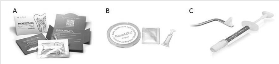
그림 6. 최근 개발된 다양한 root-end filling materials. (A) ENDOCEM MTA (B) RetroMTA (C) EndoSequence BC RRM

이에 치근단 미세누출 폐쇄술을 동반하는 미세 치근단 수술을 계획하였다(그림 7C). 피관 거상, 골 삭제, 치근단 절제, 메틸렌블루를 이용한 염색 시행 후 현미경 하에서 절단된 치근단면을 관찰한 결과 missing MB2 canal과 isthmus가 관찰되었다(그림 7D). 초음파 팁을 이용한 치근단 외동 형성 후 MTA를 이용하여 역충전 시행한 뒤 피관 봉합하였다(그림 7E). 4년 정기검진 방사선 사진 상 완전한 치유가 관찰된다(그림 7F).