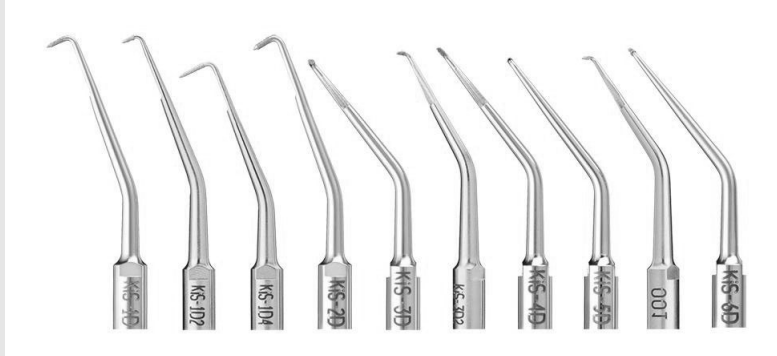
그림 5. 치근단 외동 형성을 위하여 고안된 초음파 팁. 다양한 크기와 형태를 가지므로 치아의 위치에 따라서 선택하여 사용할 수 있고, 팁에 다이아몬드 코팅이 되어 있어서 뛰어난 절삭력을 갖는다.