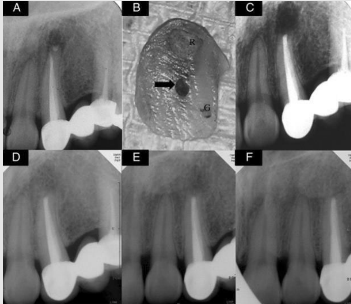
그림 4. Typical failure case of endodontic surgery a. Preoperative radiograph with periradicular radiolucency showing a root-end filling apart from the filled canal. (B) Coronal surface of the resected apical fragment. Note the missing canal (arrow) that had not been touched, even after both nonsurgical and surgical retreatments. G, gutta-percha canal filling of nonsurgical retreatment; R, root-end filling of surgical retreatment. (C) Immediate postoperative radiograph. Super EBA was used for the root-end filling. (D-F), Seven-year follow-up radiographs with 3 different angles showing complete healing.

〈출처〉 Song&Kim et al. Outcomes of endodontic micro-resurgery: a prospective clinical study. J Endod 2011;37:316-320