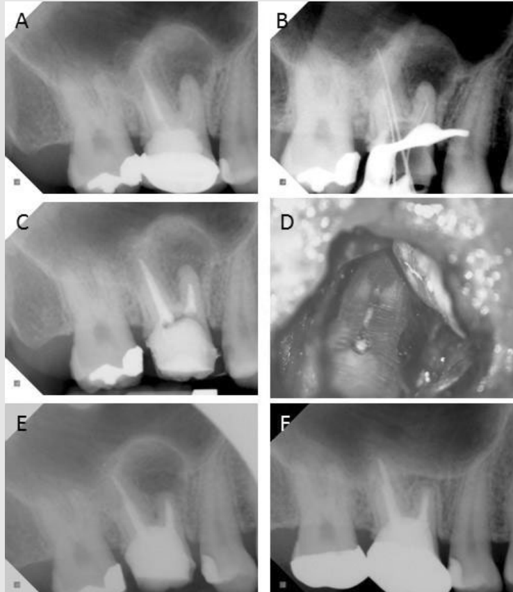
그림 7. (A) 초진 intra-oral x-ray. 불완전한 충진을 보이는 mesio-buccal root가 관찰된다. (B) 재근관치료 CLM x-ray. Mesio-buccal root의 apex negotiation에 실패하였다. (C) Canal filling x-ray. 짧게 충전된 mesio-buccal root가 관찰된다. (D) 수술 중 절단된 치근면 관찰 사진. MB canal은 gutta-percha로 충전되어 있으나 missing된 MB2 canal과 isthmus가 관찰되었고, 재근관치료 실패의 원인으로 생각된다. (E) 미세 치근단 수술 직후 x-ray. (F) 4년 follow-up x-ray. 완전히 치유된 것을 확인할 수 있다.