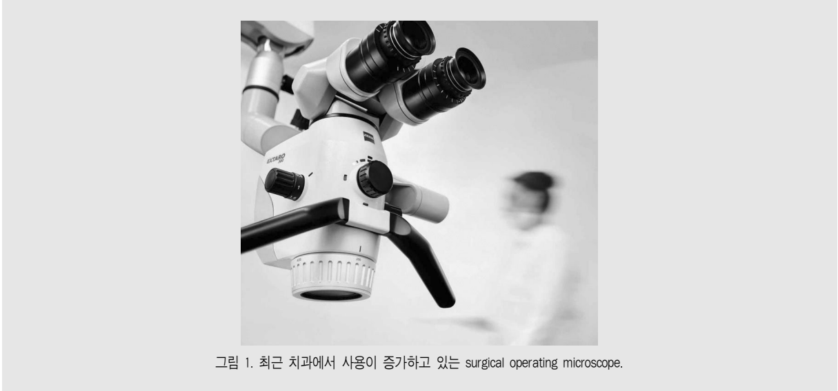
그림 1. 최근 치과에서 사용이 증가하고 있는 surgical operating microscope.

형성하고 round bur를 이용하여 유지형태를 부여한다. 이후 아말감 및 IRM을 이용하여 역충전을 시행한다.