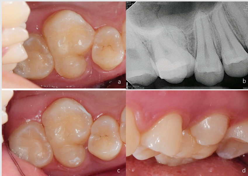
Fig. 5. (a) 3개월 경과 관찰 시 #16의 구내 촬영 사진(교합면), 협측 교두의 원심측으로 과잉의 복합레진 수복물이 관찰된다; (b) 3개월 경과 관찰 시 #16의 치근단 방사선 영상; (c) 6개월 경과 관찰 시 #16의 구내 촬영 사진(교합면); (d) 6개월 경과 관찰 시 #16의 구내 촬영 사진(협면)