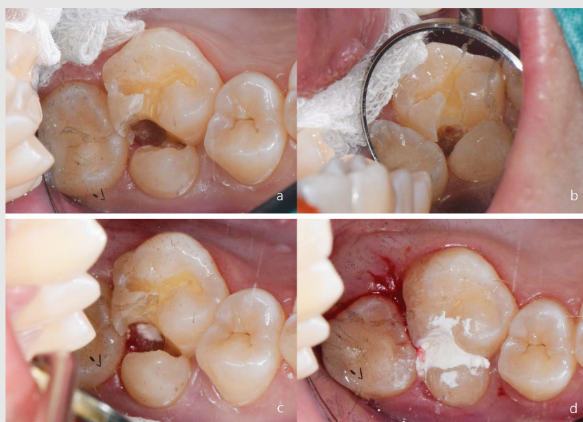
Fig. 3. (a) 교합면의 기존 수복물과 우식 제거 후; (b) #16의 설측 치수강의 원심 협측 치수각이 기계적으로 노출된 상태; (c) MTA로 직접 치수 복조 후; (d) 구개측 치관의 교합면 복합레진 수복 및 구개측과 협측 치관 사이의 와동을 임시 가봉한 상태.

Zahnfabrik, Bad S?ckingen, Germany)를 이용해 해당 치아의 색조를 A2로 결정하였다. 치아에 러버댐 클램프가 걸리지 않아 cotton roll로 방습을 시행하였다. 우선 유합된 부위의 홈에서부터 원심 인접면 방향으로 round diamond bur(BR-31; MANI Incorporation, Tochigi, Japan)를 이용하여 고속 핸드피스로 주수 하에 우식을 제거하였다. 또한, 교합면에 충전된 기존의 복합레진 수복물도 함께 제거하였다. 추가적으로 깊은 부위의 우식은 저속 핸드피스 및 주수 하에 round carbide bur(H1-010, 014; Komet Dental, Lemgo, Germany)로 제거하였다(Fig. 3a). 우식을 제거하던 중 #16의 설측 치수강의 원심 협측 치수각 부위의 치수가 기계적으로 노출되었다(Fig. 3b). 치수 노출 부위로 2.5% sodium hypochlorite(NaOCl)를 묻힌 멸균 cotton pellet을 넣고 10분간 기다린 뒤 지혈이 된 것을 확인한 후 mineral trioxide aggregate (MTA) 중의 하나인 RetroMTA(BioMTA, Seoul,