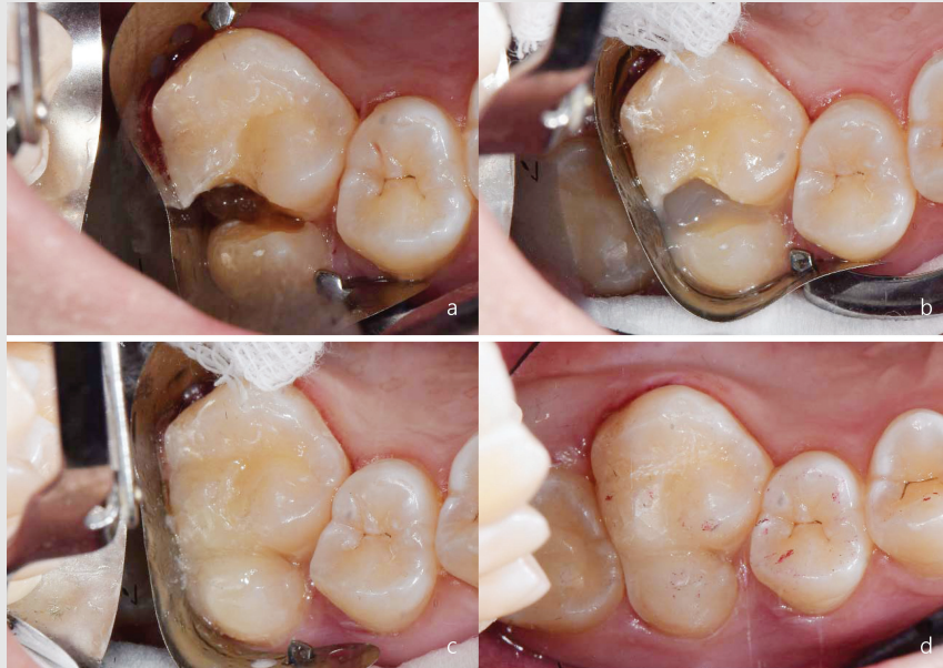
Fig. 4. (a) #16의 원심측에 ivory matrix band와 retainer를 삽입한 모습; (b) UniFil Flow로 원심 벽을 형성한 후 와동을 SureFil SDR Flow로 2회 충전; (c) 최종 수복은 Filtek Z250으로 시행; (d) 수복물의 마무리 및 연마 후 교합 확인.