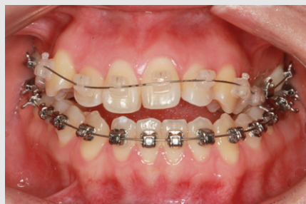
그림 10. 23개월동안 교정치료를 하였다.

상악전치의 빠드러짐과 덧니를 주소로 내원한 여대생. 개방교합을 가지고 있어서 전치의 수직위치 개선도 필요하다. 이런 경우 보철치료를 통해서도 문제 해결을 할 수는 있으나 최상의 결과를 얻기는 어렵다. 반드시 교정치료를 통해 구강구조의 기능적 심미적 개선이 필요하다.