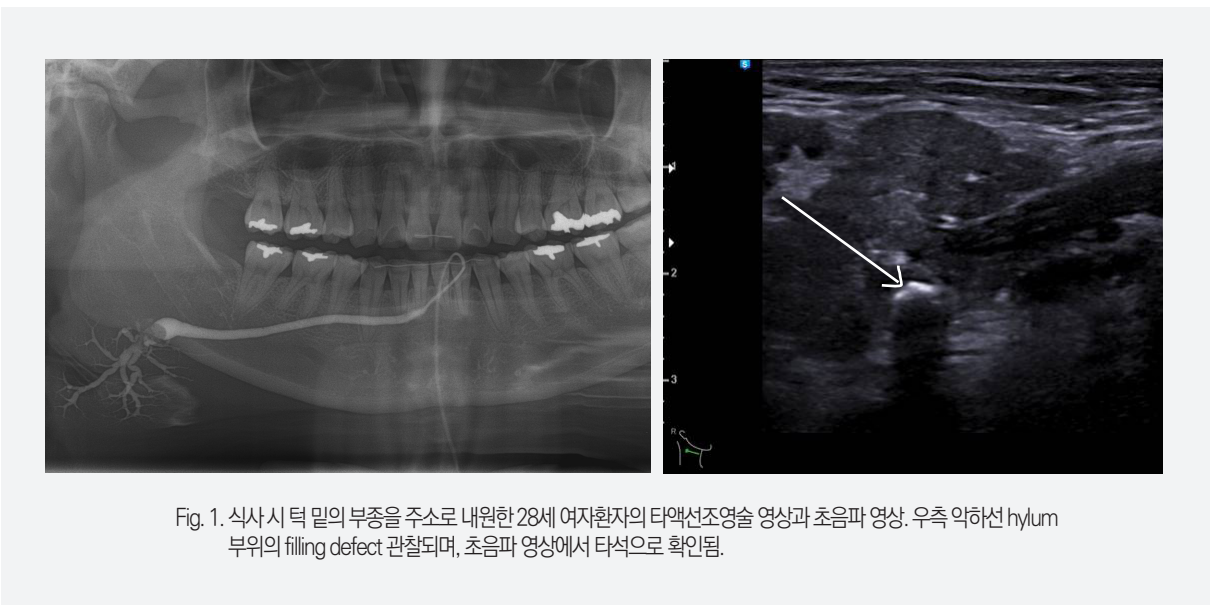
Fig. 1. 식사시 턱 밑의 부종을 주소로 내원한 28세 여자환자의 타액선조영술 영상과 초음파 영상. 우측 악하선 hylum 부위의 filling defect 관찰되며, 초음파 영상에서 타석으로 확인됨.

파노라마나 교합면방사선영상 등에서 일부 타석의 존재를 확인할 수 있으나 석회화 정도가 낮은 타석이나 영상에서 악골과 중첩되는 경우는 일반적인 방사선영상만으로는 진단하기가 어렵다. 타액선조영술은 타액이 분비되는 경로인 도관으로 조영제를 주입하여, 도관입구에서부터 실질까지 이어지는 도관의 주행과 형태 변화를 잘 관찰할 수 있다. 타액선조영술에서 타석은 보통, 조영제보다 낮은 방사선불투과성을 보여 도관을 채우는 조영제 부위 중 일부가 채워지지 않은 filling defect의 형태로 나타난다. 하지만 간혹 조영제 주입 시 공기방울이 주입되는 경우가 있어, filling defect가 공기방울에 의한