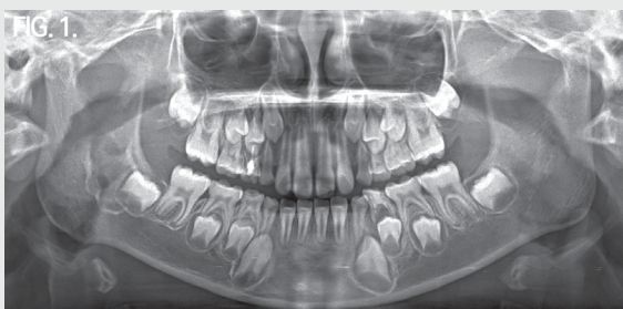
Fig. 1. Panoramic radiograph shows well-defined unilocular radiolucent lesion with scalloped corticated border at the right mandibular ramus.

수술 후 4개월 후 개구량은 30 mm 로 증가하였고, 다른 특이 임상 소견은 없었다.