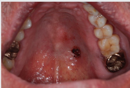
Figure 2. 절제 후 모습