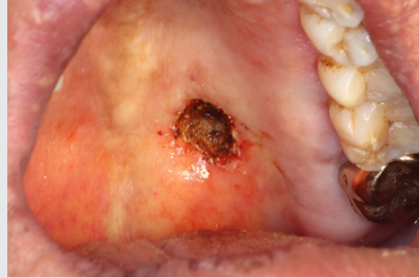
Figure 4. 재절제 후 모습

loma)으로 진단되었으며, 3개월간의 경과 관찰 중에 재발의 소견은 보이지 않았다. 재발 가능성 및 정기 검진의 필요성에 대해 설명하였다.