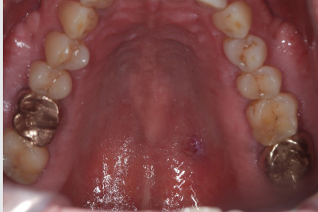
Figure 3. 재발한 병소