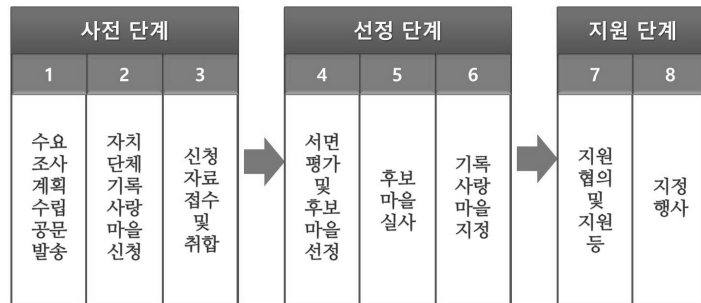
〈그림 1〉 기록사랑마을 지정과정

가지표에 따른 평가를 진행한다. 평가지표에는 기록물의 특성, 합목적성, 지역적 특성, 자발적 의지 등의 항목이 포함되어 있다(〈표 3〉 참고). 이후 현장실사를 통해 서면평가 내용의 적합성 등을 확인하여 기록사랑마을로 지정한다.