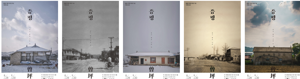
〈그림 3〉 마을기록 만들기, 경관 아카이빙의 산출물로 제작된 증평군 기록전시회 포스터 5종

전시는 남녀노소 누구나 쉽게 이해할 수 있도록 사진과 영상으로 증평의 과거와 현재를 재현하였고, 정보전달이나 설명을 위한 텍스트는 최소화하여 관람객이 전시에 집중하고 자유로운 상상이 가능하도록 기획하였다.