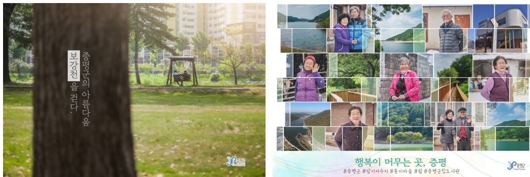
〈그림 1〉 서울지하철에 게시될 증평군 홍보물 1)

이와 같은 생각에서 예산 확보부터 시작했다. 기록관 자체예산을 도무지 세울 수 없었던 탓에 다른 부서 사업 잔액 1천만원을 빌어 1개 마을을 대상으로 사업을 진행했다. 2017년 10월부터 약 5개월간 마을사람들을 직접 만나 옛이야기와 사진을 모으는 작업을 시작으로, 모여진 이야기와 사진을 활용해 마을 이야기집을 발행하였고, 증평군 기록관의 자체 기록관리시스템에 등록하여 증평군의 기록으로 영구보존, 관리될 수 있도록 하였다. 특히 과거의 기억이나 기록들을 모으는 것에 그치지 않고 마을사람들의 사진을 찍어 현재의 기록을 만들어내는 시도도 이루어졌다. 지금의 것들은 미래에는 기록이고, 역사가 될 것이기 때문이다.