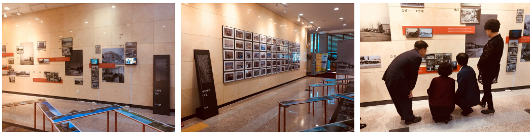
〈그림 4〉 증평군 기록전시회

전시는 작은 기록관에서 추진하기엔 버거운 일이다. 그러나 ‘보이지 않는 곳에서 묵묵히 내 할 일을 하겠어’에 만족할 수 없다면 시도해 볼만한 가치는 충분하다. 전시를 통해 지역과 교감하는 경험은 의외로 짜릿할 뿐만 아니라, 전시 준비과정에서 소장기록에 대한 이해도가 높아져 기록관의 전문성도 키울 수 있다.