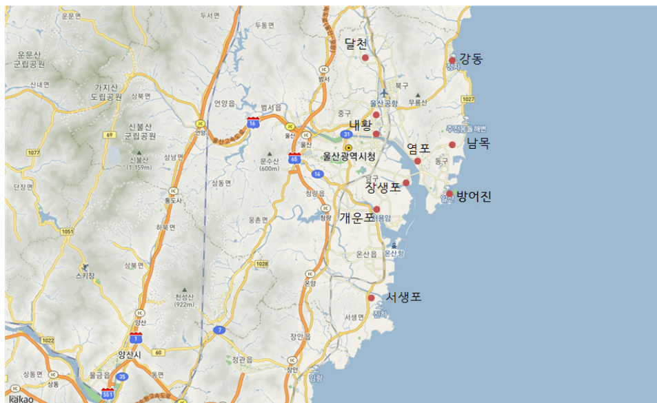
〈그림 2〉 조선시기 울산항 관련 로컬리티 공간 10)