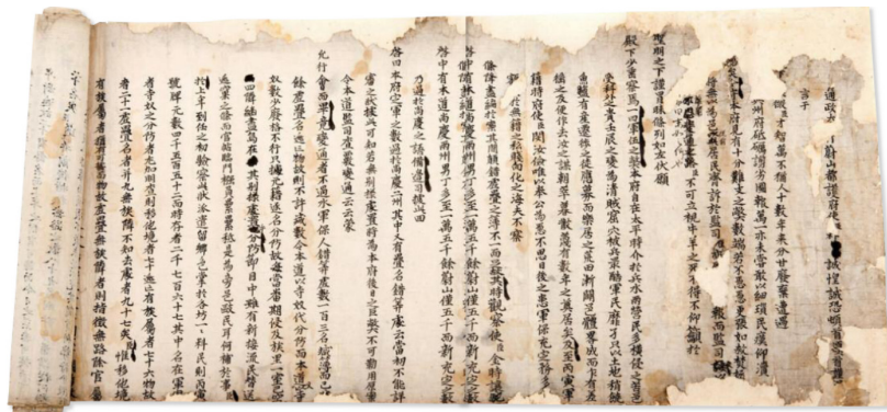
〈그림 5〉 울산민폐소(1630, 울산박물관 소장)

방어진의 사례로 알 수 있듯이, 조선시대 울산항은 각종 군사시설이 집결한 곳으로 국방의 역할을 충실히 수행하였다. 개운포의 좌수영에는 경상좌도 수군절도사가, 병영성에는 경상좌도 병마절도사가 자리했으며 왜적의 침입로에 위치하여 임진왜란·정유재란으로 피해를 많이 받은 곳이기도 했다. 국방시설이 많다는 것은 그만큼 주민들이 져야 하는 부역도 많다는 뜻이다. 박명부가 울산 도호부사로 재직하던 때 저술한 『울산민폐소(蔚山民弊疏)(1630)』에서 임진왜란과 정유재란 이후 30년 후인 인조 8년(1630) 울산과 울산 주민이 직면했던 어려움을 읊어낼 수 있다. 인조 5년(1627) 정묘호란(丁卯胡亂)이 끝나고 급증한 세와 역은 호구 수가 감소한 울산 주민에게 큰 부담으로 다가왔고, 박명부는 이를 개선하고자 군대·토지·전선(戰船)·관속(官屬)·목장에 대한 5가지 폐단을 지적하였다. 군대는 주민 숫자에 비해 군역이 과다하게 책정된 폐단을, 토지는 허결에 수세하는 폐단을, 전선은 해충이 많고 수심이 깊은 울산연안에서 전함을 건조하고 수군 훈련에 참여해야 하는 폐단을, 관속은 소수의 관속이 과중한 책임을 부담하는 폐단을 서술하였다. 목장의 경우 관리자인 목자의 수가 적으면 자연스레 관리가 소홀해지고, 이렇게 유실된 말은 과도한 포(布)로 배상하도록 요구하여 목자의 수가 적어지는 악순환을 소상히 기술하였다(이중서, 2009, p. 233). 울산은 염포 왜관이 폐쇄되고, 지리적 입지와 전란으로 중앙정부로부터 상대적으로 국방에 대한 부담이 과도하였다.