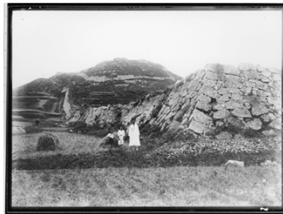
<그림 4> 울산서생진지도(경상도지도 내 발췌, 1872)<사진 1> 울산 울주 서생포성 동북면(유리건판, 국1936년)