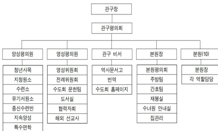
<그림 2> 성바로말수도회 한국관구 공동체 조직도

한국관구의 기록물을 관리하는 역사문서고는 관구 비서에게 소속되어 있는데 관구 비서는 관구평의회에서 다룰 의제를 미리 통고하고 회의록을 작성하며 총통솔 기구로 평의회 회의록 사본을 발송하거나 문서를 보관하는 업무를 맡는다.(성바로말수도회, 2004) 역사문서고에는 기록관리 담당자 1명이 실무를 담당하고 있으며 관구 비서와 평의회를 통해 이관된 기록을 등록·관리하고 수도회에 역사적·행정적으로 중요한 기록물을 수집·보존하는 기능을 맡고 있다.