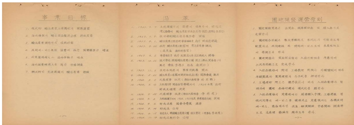
<그림 3> 사업계획서 총론 원문

기록물의 내용에 포함된 개체명의 색인화가 개체명 인식을 통해 가능한지를 확인하기 위해 우선 기록물 1건에 대하여 개체명 인식을 수행했다. 시험 방법은 특정 기록물 건의 일부에 대해 개체명 인식을 진행하여 그 결과를