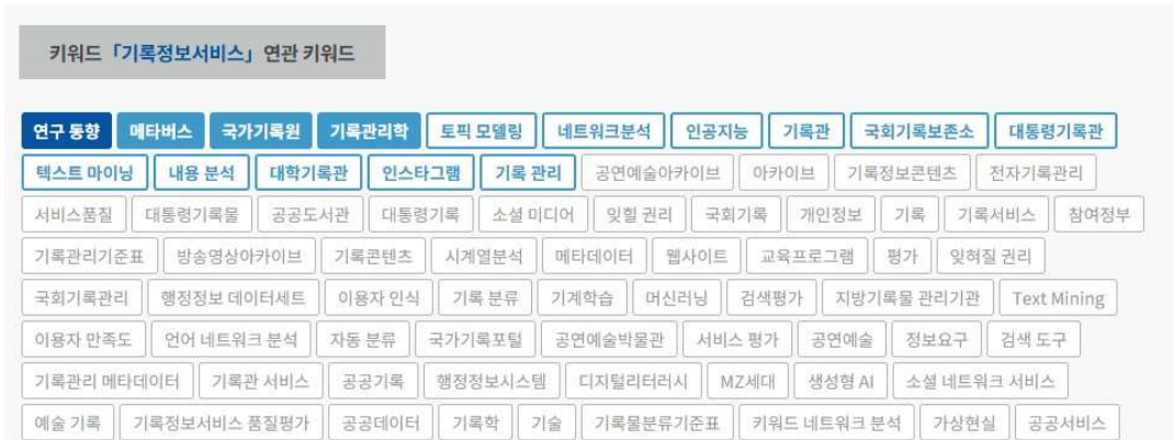
<그림 2> KCI 「기록정보서비스」 연관 키워드(일부)