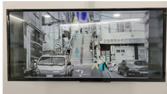
〈그림 5〉 이야기 콘텐츠 '기억의 편(片)'