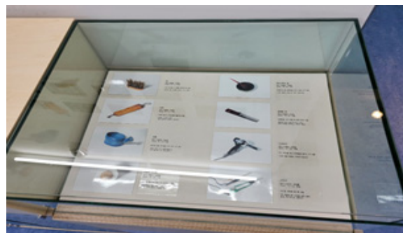
〈그림 4〉 사진 콘텐츠 '별이 머무는 곳'

사당동 주민 중 '48년 이용사'가 운영하는 이용원과 그 곳에서 사용하는 물건을 시각적으로 수집하고 펼쳐놓아 물건과 장소가 지닌 가능성을 탐구하고 48년 동안 반복된 일상에 이야기를 덧입힌 사진집을 전시함으로써 과거와 현재를 돌아볼 수 있도록 구성하였다.