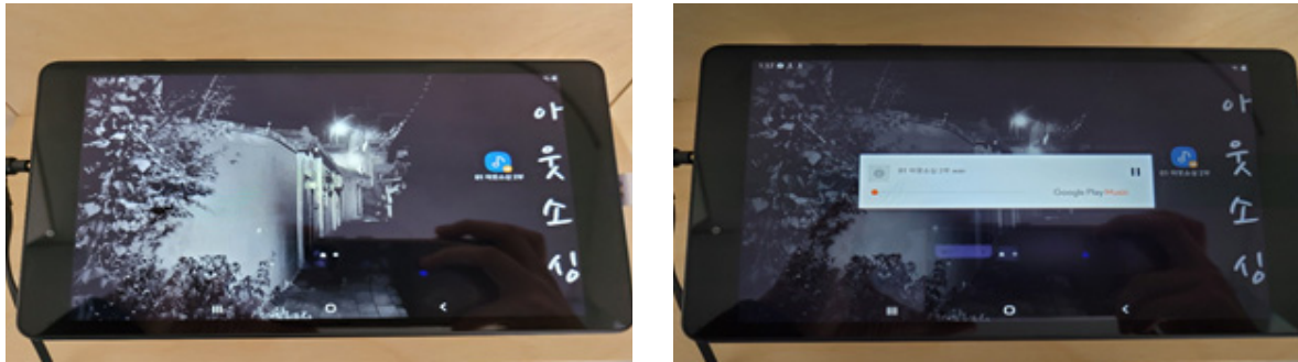
〈그림 6〉 오디오 콘텐츠 '아웃소싱'

상도동 주민들과의 인터뷰를 바탕으로 상도동 지역 사진 위에 그림을 덧씌운 삽화와 스토리텔링을 결합한 예술작품으로 제작하여 주민의 일상과 지역의 변화를 함께 표현하고자 하였다. 또한 작품은 전자책과 도록(B4)도 함께 제작하여 지역 주민 누구나 작품을 감상할 수 있도록 전시하였다.