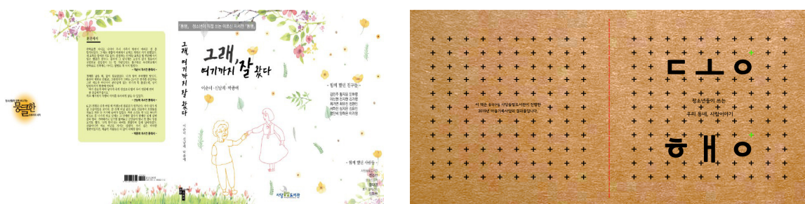
〈그림 1〉 왼쪽부터 2017년, 2019년 동행 프로젝트 표지

동행 프로젝트는 지역의 문화와 주민의 생애를 기록으로 남기기 위해 시작된 지역 아카이브 사업으로 지역에서 오랫동안 거주하신 어른들의 이야기를 지역의 청소년들이 직접 듣고 남길 수 있는 자서전의 형태로 시작되었다.