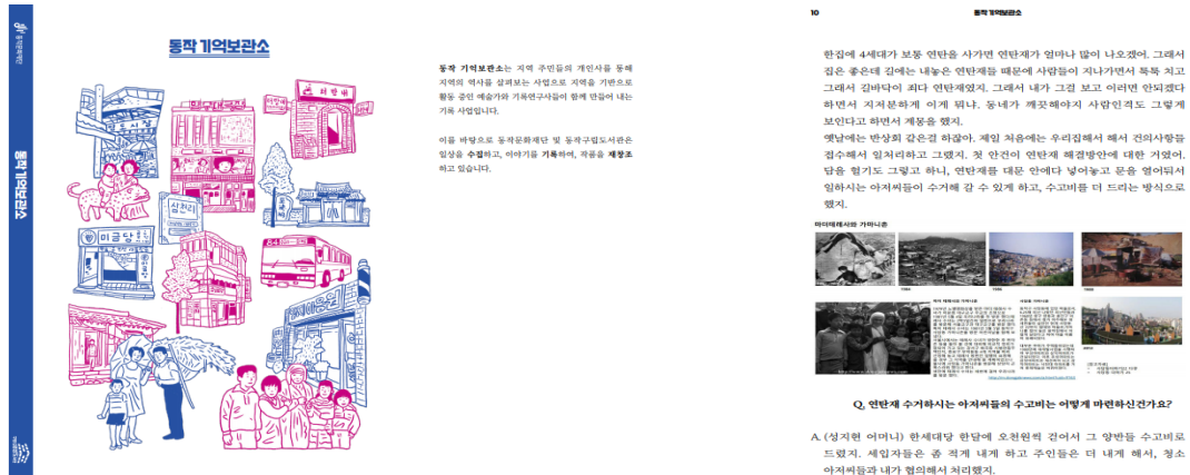
〈그림 3〉 구술자료집

사당, 상도, 후석 지역에서 채록한 구술을 바탕으로 사진과 삽화, 그림 등을 넣어 전체적으로 큰 틀은 통일하고 목차별 내용은 구분하여 지역의 이야기를 조금 더 쉽고 재미있게 볼 수 있도록 연구자료집보다는 소설책 형태로 제작하였다.