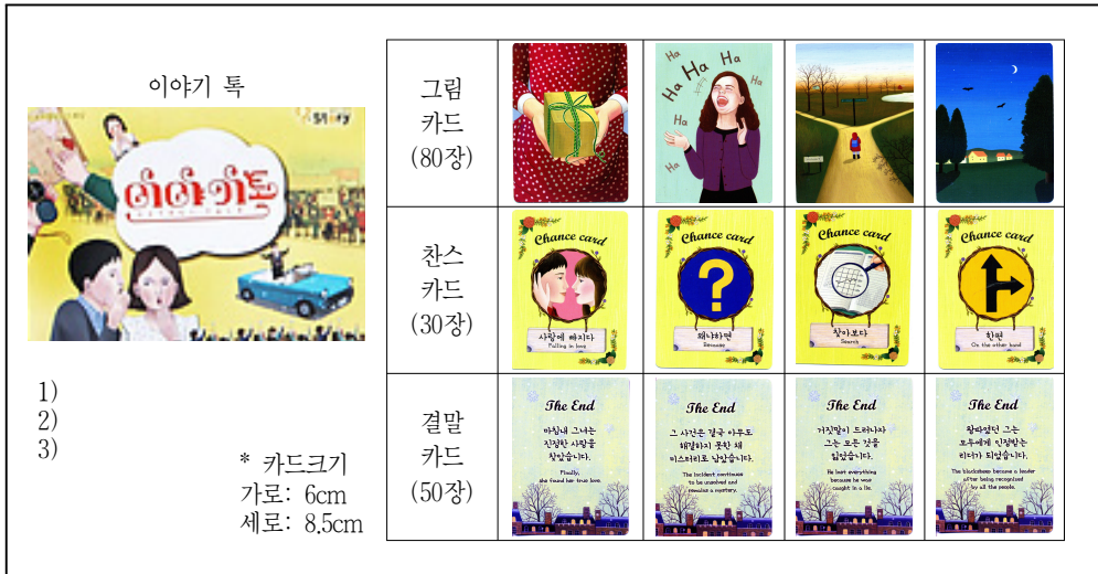
〈그림 1〉 이야기 특 카드 예시

드 30장), 결말 카드 50장 그리고 빈 카드 10장으로 구성되었다. 그림카드를 보면서 이야기와 사진, 캐릭터, 감정, 사물, 배경 등을 표현하는 데 사용할 수 있고, 찬스카드는 글과 그림이 함께 있는 형태로, 그림보다는 글에 시선을 주고, 복선 및 이야기의 반전이 가능한 소재로 구성하였으며, 결말카드는 이야기의 기본 패턴으로 구성되어 있고, 이론적 명확성에 기반을 두어 감정과 상태를 반영하였다.