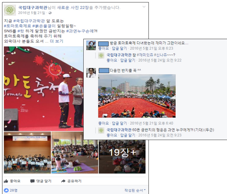
<그림 2> '행사 & 프로그램' 게시물 예시