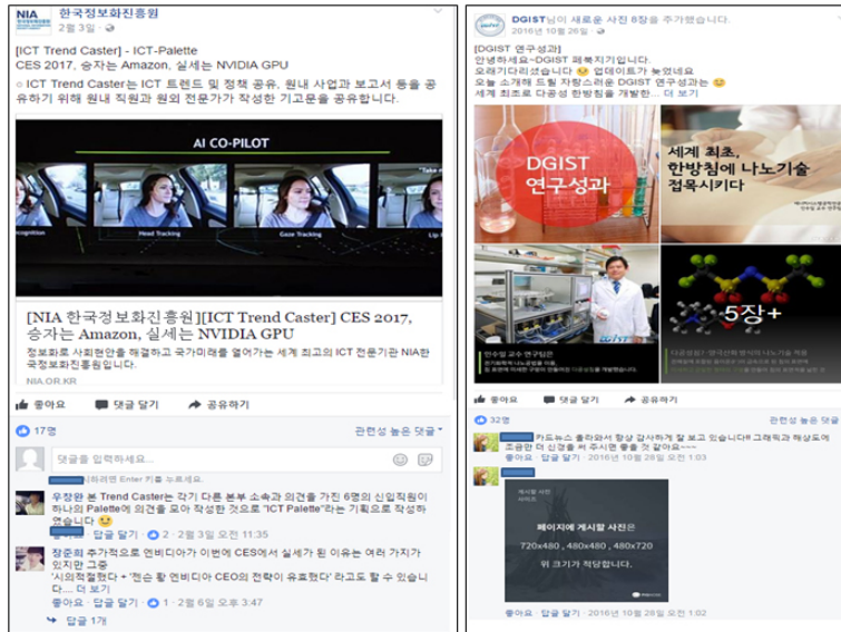
<그림 1> '정보/지식 공유' 게시물 예시