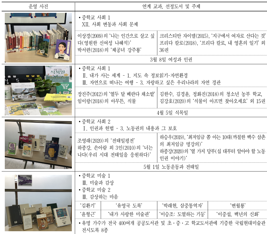
<표 1> 인천 A중학교 북큐레이션 운영 사례

<표 1>은 인천 A중학교에서 전교생을 대상으로 북큐레이션을 운영한 사례이다. 교과에 맞춰 매월 주제를 선정했다. 사회 1 교과의 '2장 내가 사는 세계', '3장 자연으로 떠나는 여행'을 참고하고 식목일과 접목하여 북큐레이션 활동을 하였다. 선정 자료의 키워드 검색어는 '가드닝', '식물', '농사', '농부'였다. 사서교사가 키우는 식물들을 책 사이에 배치하여 관심 있는 학생들에게 식물과 연필씨앗을 소개하고 나눠주기도 했다.