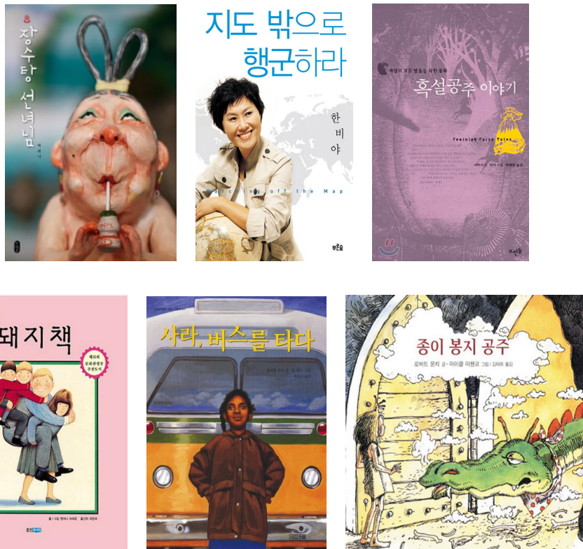
<그림 3> 다대출 도서 사례

앞서 장서 분석에서도 보았듯이 양성평등 도서가 고루고루 대출되는 것으로 보이나 대출 상위 목록을 살펴보았을 때 모든 도서관에서 비슷한 도서에 치중되어 장서 대출이 됨을 확인할 수 있었다.