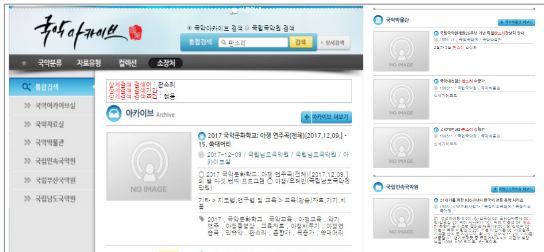
※ ‘관소리’란 키워드로 검색했을 경우, 아카이브, 국악박물관, 국립민속박물관 등 소장처별 검색을 제공함

반면, 검색 서비스 중 가장 부족한 부분은 온라인 통합검색 서비스이다. 온라인 통합검색은 타 기관의 소장 자료까지 통합적으로 보여주는 서비스로 현재 무형문화유산 기관 중 유일하게 국악원에서만 제공하고 있다. 국악원은 “국악 아카이브” 구축을 통해 민속국악원, 남원 민속국악원, 진도 남도국악원, 부산국악원 등 타 기관이 소장하고 있는 자료들에 대한 검색 서비스를 제공하고 있다(〈그림 2〉 참조). 그러나 나머지 기관들은 자관의 소장 자료를 통합 검색할 수 있지만, 타 기관의 소장 자료까지 검색할 수 있는 온라인 통합검색 서비스는 제공하지 않고 있다. 그 외에 검색매뉴얼 서비스는 무형유산원이 유일하게 제공하고는 있으나, DB 검색 시 띄어쓰기 유의사항을 안내하는 정도로 그치고 있어 제공되는 서비스 수준은 상당히 미흡한 편이다.