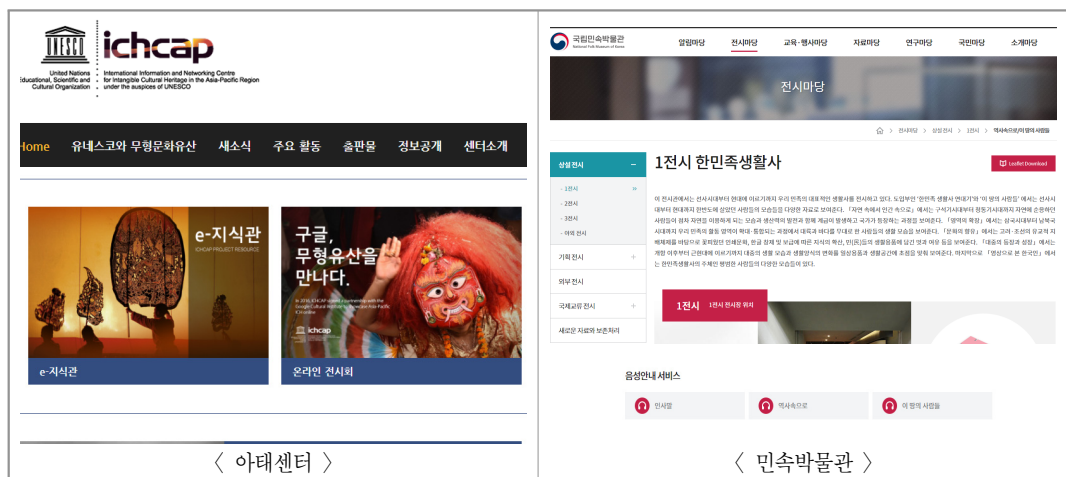
〈그림 3〉 온라인 전시 서비스

무형문화유산은 살아있는 기록 그 자체이다. 즉, 기존의 기록물은 유형의 형태를 지닌 과거의 산물인 경우가 많지만 무형문화유산은 무형