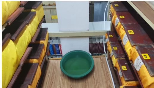
고문서 보존 환경

몽골 국립박물관은 2023년 기준 약 6만 점의 유물을 보존하고 있다. 몽골 국립박물관은 4년마다 보유하고 있는 유물의 목록을 업데이트하여 문화부에 제출해야 하지만 바코드 시스템을 통해 유물을 점검하여 4년마다 자체 유물을 확인하는 것이 어려운 상황이다.