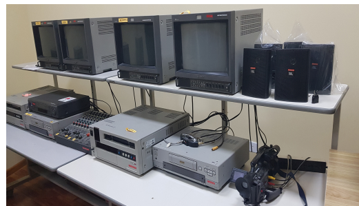
테이프 녹화 및 재생