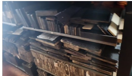
목관 자료 보존 환경