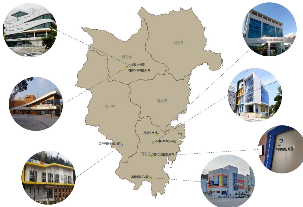
<그림 3> 기장군 행정구역 및 도서관 분포