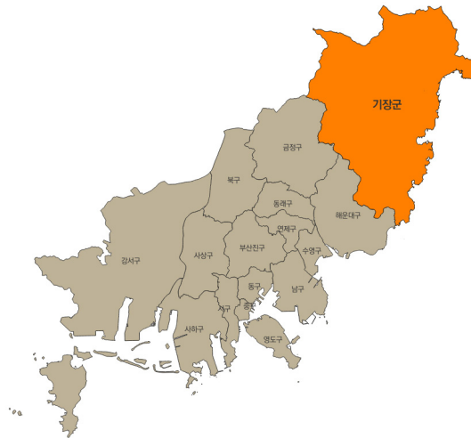
〈그림 2〉 부산광역시 기장군의 위치 및 행정구역