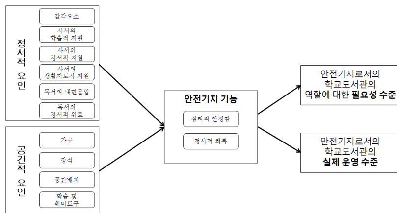
〈그림 2〉 요인 분석에 따른 구조방정식 모형 설계