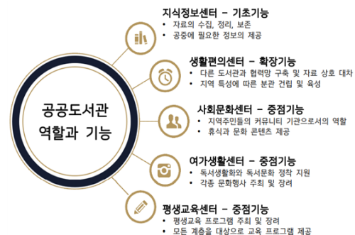
<그림 1> 공공도서관 역할과 기능

또한 한국도서관협회에서 발행한 『한국도서관 기준』에서는 공공도서관의 목적을 다양한 자료와 시설, 봉사활동을 통하여 지역주민의 정보이용, 문화 활동, 평생교육을 증진함으로써 지역사회의 지식 향상과 문화 발전을 도모한다고 밝히고 있다. 문화체육관광부에서는 지식과 정보의 공유 및 독서 공간이라는 도서관 본래의 목적 이외에 문화 다양성의 수용, 지역사회 구성원들의 이해와 소통, 그리고 우리의 미래를 담보할 수 있는 의미 있는 통합공간으로 거듭나야 할 필요성을 제기하면서 도서관의 역할과 기능을 <그림 1>과 같이 제시하였다(문화체육관광부, 2019).