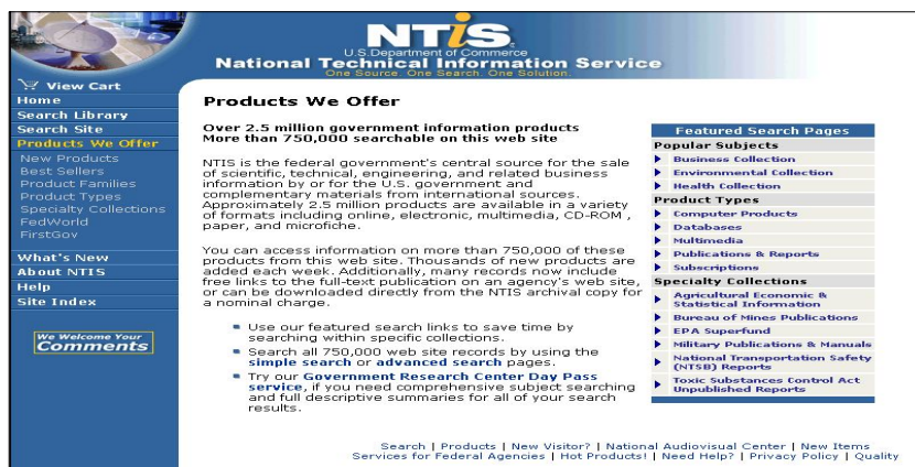
〈그림 3〉 NTIS 웹사이트 메인 화면

정보서비스, 프로젝트 관리서비스 등의 3가지로 구분할 수 있으며, 이 가운데 정보서비스는 일반에 제공되는 서비스 및 FedWorld를 통한 온라인 정보서비스 외에 각 정부기관을 위한 특별서비스가 있으며, 이러한 서비스는 결국 정부기관에서 생산·관리되는 정보를 통합적으로 제공할 수 있는 기반이 되고 있다.