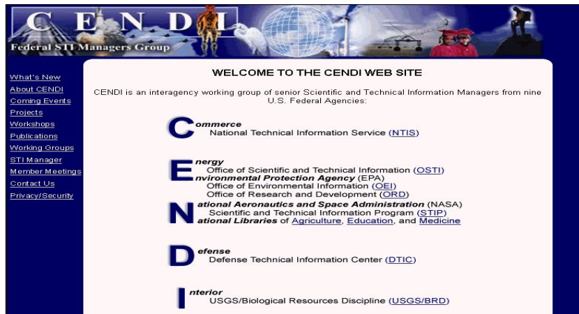
〈그림 2〉 CENDI 웹사이트 메인 화면