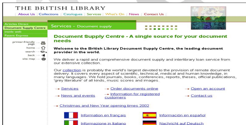
〈그림 3〉 The British Library 사이트 BLDSC 메인 화면

영국의 정보서비스 체계는 정보정책과 관련된 총괄업무는 영국국립도서관(BL: The British Library) 산하 과학기술정보조정위원회가 맡고 있으며, 정보관리체계는 영국국립도서관(이하 BL이라 한다.)을 중심으로 하는 중앙집중체제를 구축하고 있다. BL내에 과학기술산업부를 두어 BLAISE(The British Library's Online Information Service) 네트워크를 통해 세계 각국의 과학기술, 특허정보 등을 제공하고 있다. BL은 정보수집 및 정보서비스를 위한 기관으로서 문헌정보센터(BLDSC: British Library Document Supply Centre)를 설치·운영하고 있다.