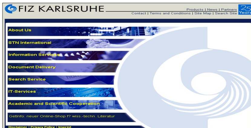
〈그림 6〉 FIZ Karlsruhe 웹사이트 메인화면

Device) 시스템의 일원적 지도·관리를 위한 GID(정보·도큐멘테이션 연구소)를 네트워크의 정점에 내세우고 있다.