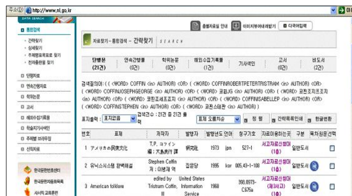
〈그림 3〉 ‘통합검색 -- 간략찾기’: 저자 ‘Coffin’ 검색결과 (2006.2.8)

〈그림 4〉는 검색질의어를 결과화면에서 ‘검색질의어:((Coffin))’의 형태로 다시 보여주고 있다. 이는 검색질의어를 입력한 형태 그대로이다. 이 같은 변화는 ‘OPAC 디스플레이 지침 (초안)’의 1.4항에서 ‘텍스트 데이터를 입력한 대로 디스플레이 하고...’라는 점을 강조하고, 그 내용에서 ‘목록자가 입력한 대로 구두점을