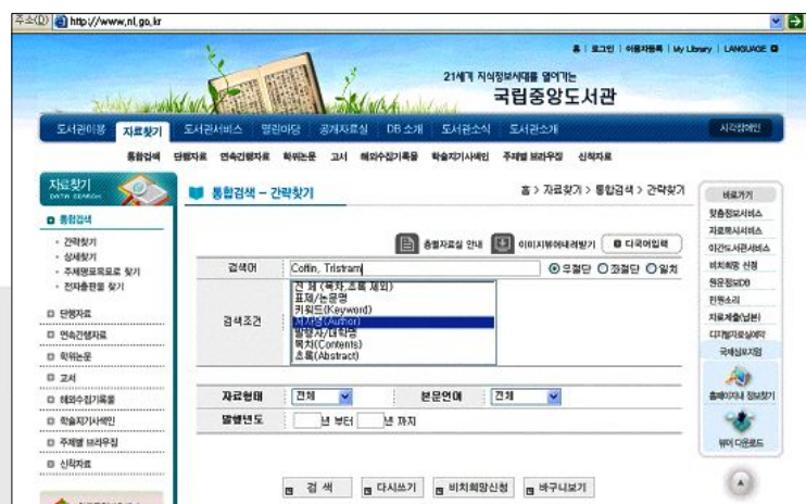
〈그림 1〉 국립중앙도서관 OPAC ‘통합검색 -- 간략찾기’: 저자명 ‘Coffin, Tristram’ 검색(2006.2.8)

명, 발행자, 목차, 초록 등의 필드를 지정할 수 있게 함으로써 어떤 색인에서 찾을 것인지를 제한할 수 있었다. ‘저자명’ 필드에서 ‘OPAC 디스플레이 지침(초안)’의 보기에서 사용된 이름인 Coffin, Tristram을 탐색했을 때, 간략목록에 1개의 레코드(표제: American folklores )