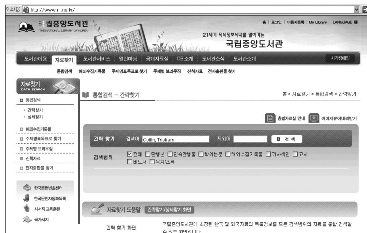
〈그림 2〉 국립중앙도서관 OPAC: ‘통합검색 -- 간략찾기’ (2006.2.13)