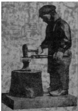
그림1-『조선문예』 2호 표지 사진

『조선문예』 2호 표지의 철을 두드리는 노동자의 사진은 계급의식의 표현으로 독해될 수 있다. 문제는 계급의식이 표현되는 맥락이다. 노동자가 담금질하는 철은 생산력을 높이기 위해서 꼭 필요한 것이다. 생산력