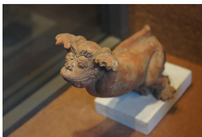
<그림 11> 자카르타국립박물관 테라코타 전시실.

안산암이라는 재료가 일반적으로 사용되었지만, 14세기에서 15세기에 걸쳐 제작된 동부자바기의 석상은 사암 혹은 석회암이 사용되기도 했다. 4세기에서 10세기에 걸쳐 힌두교 및 불교의 영향이 인도네시아에 널리 퍼져 있었는데, 이 시기에 조성된 석