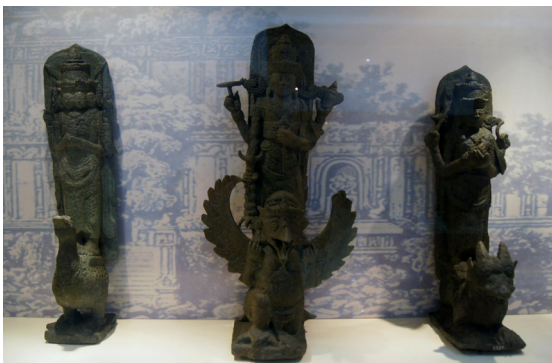
<그림 5>三大神 트리무르티. 11-12세기. 인도네시아 남수마트라 팔렘방 출토. 높이 (왼쪽부터) 57cm. 57cm. 46cm.

고, 청동북<그림 3>을 비롯하여 그 대표적인 것이 청동기실에 진열되어 있다. 대표적인 작품을 몇 예 들어보면, <그림 4>의 대형의 불상은 복잡한 납형 철조의 기법을 구사한 작품이다. 내부는 비어있고, 인도네시아에서 발견된 청동제 불상으로는 두 번째로 큰 것이다. 다만, 불교문화의 흔적이 전혀 없는 지역에서 발견된 점에서 선원들 사이에서 크게 신앙되었던 디팡카라불로 추정되며, 난파한 선박에서 해안가로 끌어올려왔던 것으로 추정된다. 트리무르티<그림 5>는 힌두교를 대표하는 3대신, 브라흐마, 비슈누, 시바를 뜻한다. 이들 신들은 승물(乘物)이라는