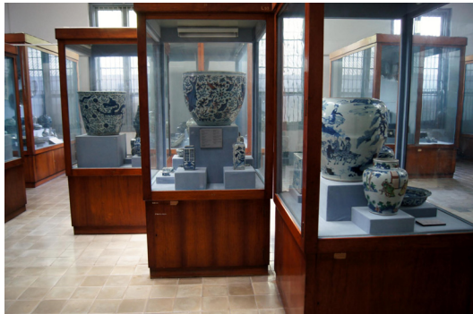
<그림 7> 도자기 전시실.

수많은 선박이 목적지에 도착하기도 전에 침몰했고, 물물교환용으로 적재되었던 도자기 등의 화물이 해안가로 밀려왔다. 이처럼 표류한 도자기류는 주로 가정에서 일상용품으로 사용되었다. 또 수가 적은 고급 도자기류는 경쟁적으로 구매하여 전래의 가보로서 대대로 소중하게 계승되어져 자녀의 출생을 비롯한