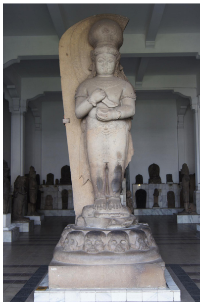
<그림 15> 바이라바. 13~14세기. 인도네시아 서수마트라 빼당 라와스 출토. 높이 414cm.

한편, 자카르타국립박물관 소장품 중에서 제일 큰 바이라바상<그림 15>은 힌두교 시바신이 분노한 모습을 표현한 것으로 허리에는 힌두교의 수호신 칼라의 장식을 한 벨트를 차고 있다. 칼라의 입에서 늘어뜨린 장식 끝에 달려있는 방울<그림 16>은 탄드리교의 심볼로, 이