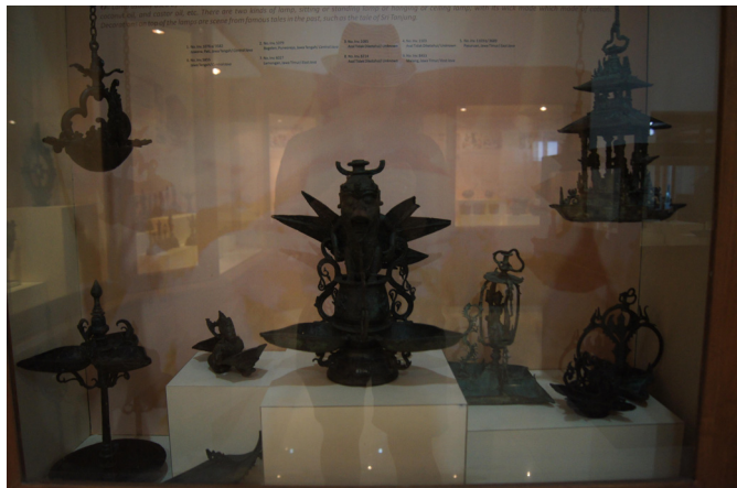
<그림 6> 램프. 13세기. 인도네시아 중부자바 문티 란에서 매입. 높이 30.5cm.

정교하게 만들어진 끈 달린 램프<그림 6>는 병 위에 앉은 카루다의 손과 발이 의인화되어 있는 점에서 동부자바기의 것으로 추정된다. 또 병의 대좌 다리의 형상과 병 주위에 있는 8개의 글자모양을 한 넝쿨형태의 장식도 동부자바기의 청동기에서 자주 보이는 특징이다. 13세기 경 태양신 수리야가 하루의 일과를 끝내면, 야간에는 비슈누신이 램프를 밝혔다고 믿고 있었다. 이와 같은 이야기를 근거로 비슈누신의 승물