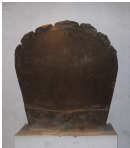
<그림 12> 석비.

<그림 12>의 석비는 남 수마트라의 팔렘방, 바투호수에서 출토한 것이다. 반원형의 모습에 상부에는 7마리의 코브라의 머리가 표현되어 있다. 그 아래 정면에는 28행의 문자가 새겨져 있는데, 오랜 세월 속의 풍화에 의해 몇몇 문자밖에 해독할 수 없다고 한다. 하단에는 수평의 단사에 의해 길게 도랑처럼 패인 줄이 새겨져 있고, 중앙에는 요니의 형태를 한 물이 흘러나오는 꼭지 부분으로 되어 있다. 명문은 말레이고어로 쓰여 있는데, 이 문자는 스리비자야의 명문에서도 사용되었고, 후에 팔라바문자로 된 것이라 한다. 명문에는 스리비자야왕에게 충성을 다하지 않는 자, 적과 밀통하여 왕에게