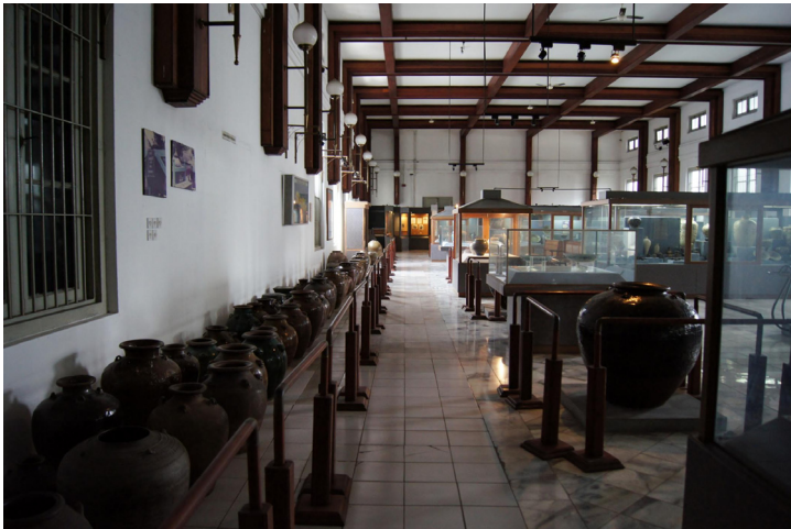
<그림 8> 도자기 전시실.