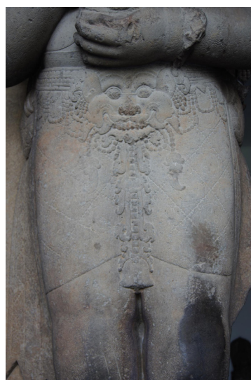
<그림 16> 바이라바 세부모습.