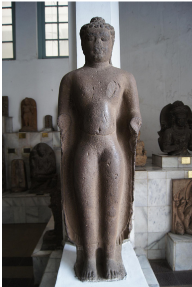
<그림 13> 불입상. 수마트라섬 잠비 출토. 안산암. 높이 172cm. 7-8세기.

<그림 13>은 수마트라의 잠비(Jambi)에서 출토한 불입상으로 7-8세기의 작품으로 추정된다. 불의는 통견으로 양쪽 팔꿈치 이하는 손상되었지만, 남아 있는 부분으로 추측해 볼 때, 오른팔을 팔꿈치를 거의 직각으로 굽히고 어깨 부근으로 올려 시무외인을 짓고 있었다고 보이며, 왼팔은 팔꿈치 부분이 약간 밑을 향하고 있는 것으로 보아 수하하여 옷깃을 잡고 있었을 것으로 추정된다. 나발은 편평하고 성글게 표현된 것이 특징으로 육계는 정상에서 약간 뒤로 치우쳐진 듯하다. 머리 뒤로는 두광이 마련되어 있었을 것이나 지금은 목 뒷부분에 그 흔적만 남아 있다. 얼굴과 양손 등 마멸과 손상이 심한 편이지만, 신체 전반에서 풍기는 괴량감은 그대로 보존되어 있다. 이 작품이 출토한 수마트라 섬의 잠비는 말라유(Melayu, 말레이Malay) 왕국의 판도에 속하는