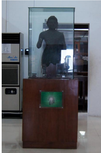
<그림 4> 청동불입상. 7세기. 인도네시아 슬라웨시 시켄덴. 1921년 발견. 높이 75cm.

고, 청동북<그림 3>을 비롯하여 그 대표적인 것이 청동기실에 진열되어 있다. 대표적인 작품을 몇 예 들어보면, <그림 4>의 대형의 불상은 복잡한 납형 철조의 기법을 구사한 작품이다. 내부는 비어있고, 인도네시아에서 발견된 청동제 불상으로는 두 번째로 큰 것이다. 다만, 불교문화의 흔적이 전혀 없는 지역에서 발견된 점에서 선원들 사이에서 크게 신앙되었던 디팡카라불로 추정되며, 난파한 선박에서 해안가로 끌어올려왔던 것으로 추정된다. 트리무르티<그림 5>는 힌두교를 대표하는 3대신, 브라흐마, 비슈누, 시바를 뜻한다. 이들 신들은 승물(乘物)이라는