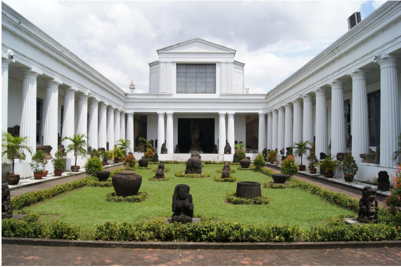
<그림 1> 자카르타국립박물관 중앙 정원.