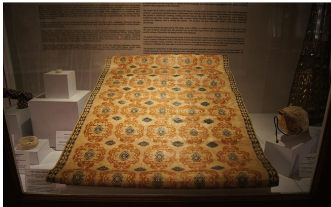
<그림 10> 바틱 전시실.

인도네시아는 풍부한 염직 전통을 갖고 있으며, 국립박물관 컬렉션이 그 문화유산을 여실히 반영하고 있다. 전설에 의하면 어떤 여신이 인도네시아에 면을 가져와서 사람들이 천을 짤 수 있도록 자신이 방직