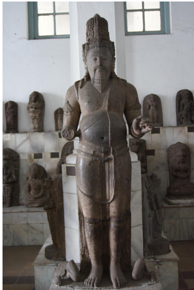
<그림 14> 아가스티야 입상. 중부자바, 찬디 바논 출토. 안산암. 높이 196cm. 8-9세기.