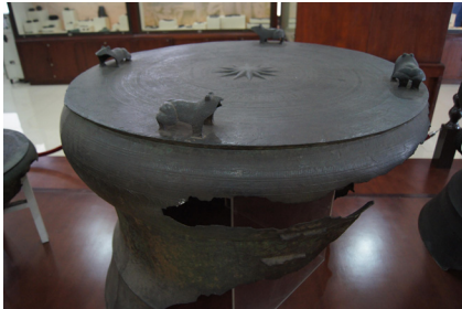
<그림 3> 청동북(동고). 기원전 2세기경~기원후4세기경. 인도네시아 서누사 텡가라, 비마 상케양 섬 출토.